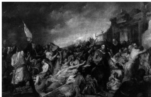
Ροσινιόν, Η τελευταία μετάληψη των Μεσολογγιτών

Η εικόνα του μωρού που θηλάζει συνδέεται άμεσα με τον πίνακα του γάλλου ζωγράφου Φρανσουά-Εμίλ Ντελανσάκ με τίτλο Επεισόδιο από την έξοδο του Μεσολογγίου ή Η Μεσολογγίτισσα (1828). Το έργο βρίσκεται σήμερα στη Δημοτική Πινακοθήκη του Μεσολογγίου. Ο ζωγράφος απεικονίζει τη νεαρή μάνα, η οποία έχει ήδη σκοτώσει το μωρό της και ετοιμάζεται να αυτοκτονήσει, προκειμένου να μην πέσει στα χέρια των Τούρκων. Η αυτοκτονία θα την απαλλάξει από μια ζωή ατίμωσης και σκλαβιάς. Στο βάθος του έργου, η παρουσία των αρχαίων ερειπίων υποδηλώνει την ιστορική επιταγή που σπλίζει το χέρι