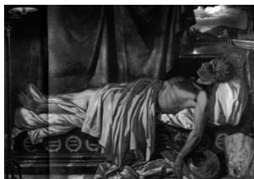
Οντεβέρ, Ο θάνατος του Βύρωνα

Η επίσκεψη του Βύρωνα στον τάφο του Μπότσαρη αναπαρίσταται στον πίνακα του Λουδοβίκου Λιπαρίνι Ο όρκος του Λόρδον Βύρωνα στον τάφο του Μάρκου Μπότσαρη , έργο το οποίο σήμερα βρίσκεται στο Δημοτικό Μουσείο (Museo Civico) του Τρεβίζο. Ο θάνατος του Μπότσαρη αποτέλεσε προσφιλές και επανερχόμενο θέμα για τους ευρωπαίους ζωγράφους. Ας θυμηθούμε το έργο του