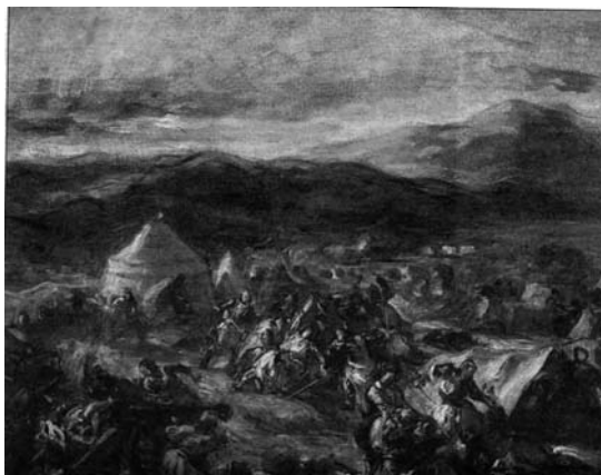
Ντελακρουά, Ο Μπότσαρης αιφνιδιάζει το στρατόπεδο των Τούρκων

Οι αντιλήψεις του Ντελακρουά φαίνονται καθαρά στο έργο του Ο Μπότσαρης αιφνιδιάζει το στρατόπεδο των Τούρκων . Στο έργο αυτό, η ποικιλία και η δύναμη των χρωμάτων αντικαθιστά το σκιοφωτισμό στην απόδοση της εικόνας. Δεν έχουμε εδώ τη αυστηρή απεικόνιση των μορφών με εμμονή στην περιγραφή των λεπτομερειών του κάθε αφηγηματικού στοιχείου, η οποία οδηγεί σχεδόν αναπόφευκτα στο διασκορπισμό του περιεχομένου. Στο έργο αυτό παρατηρούμε ότι στο σχέδιο είναι εμφανές ένα σπάσιμο της γραμμής στα περιγράμματα, ενώ στο χρώμα είναι φανερός ο περιορισμός των διαδοχικών αποχρώσεων. Οι εμφανείς πινελιές ζωηρών χρωμάτων σχεδόν αμιγών στο αριστερό τμήμα του έργου, όπως και η διαμόρφωση του φωτός σε φωτεινές και σκιερές δέσμες, προσδίδουν πρωτόφαντη ένταση στην κίνηση και δημιουργούν την αίσθηση της ταχύτητας, την αίσθηση μιας αυτοσχέδιας σημείωσης. Συνακόλουθα, προβάλλουν νοηματικά το αιφνίδιο και το εκρηκτικό της εφόδου. Είναι ένα έργο του οποίου η εκτέλεση