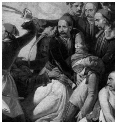
Ες, Ο Μάρκος Μπότσαρης στη μάχη του Καρπενησιού

Ο έπαινος του Μάρκου Μπότσαρη απαντάται και στο ποίημα του 1823 «Εις Μάρκο Μπότσαρη», στο οποίο η Δόξα, πλάι στον τάφο του ήρωα, κλαίει για το θάνατό του. Η ίδια μορφή, η οποία πενθεί τον Βύρωνα στο ποίημα «Εις το θάνατο του Λόρδου Μπαίρον», εμφανίζεται και σε αυτό το ποίημα. Η αναφορά στη λιμνοθάλασσα του Μεσολογγίου μπορεί να συνδεθεί επίσης με την πρώτη πολιορκία: