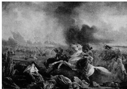
Λανγκλουά, Η επίθεση του Ιμπραήμ πασά εναντίον του Μεσολογγίου