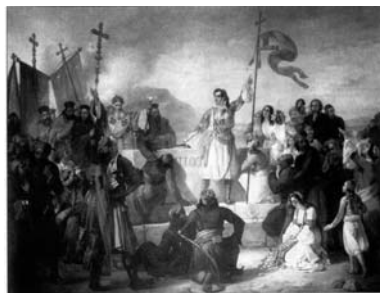
Λιπαρίνι, Ο όρκος του Λόρδον Βύρωνα στον τάφο του Μάρκου Μπότσαρη .