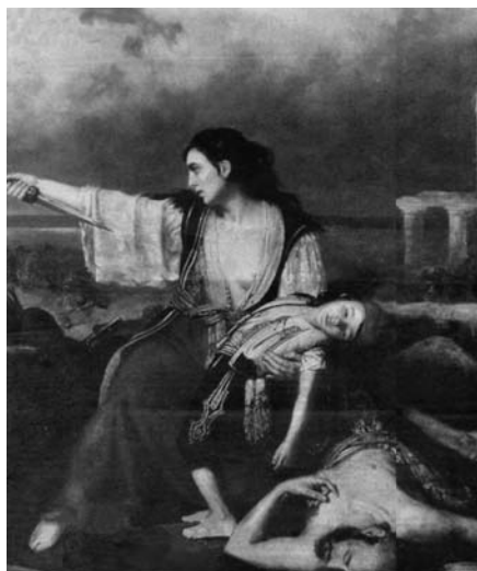
Ντελανσάκ, Επεισόδιο από την έξοδο του Μεσολογγίου ή Η Μεσολογγίτισσα