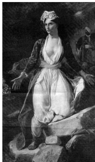
Ντελακρουά, Η Ελλάδα στα ερείπια του Μεσολογγίου

(στρ. 82) Και εσύ θάνατη, εσύ θεία, / που ό,τι θέλεις ημπορείς εις τον κάμπο, Ελευθερία, / ματωμένη περπατείς.