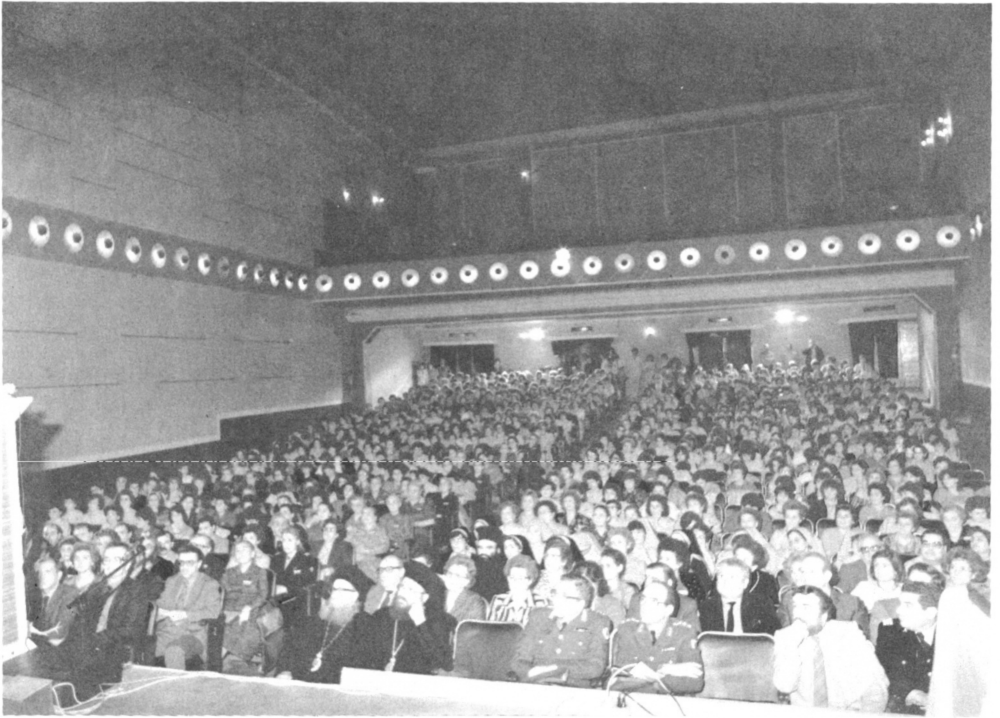
Εικόνα 2. Πολυάριθμο ακροατήριο παρακολούθησε με ιδιαίτερο ενδιαφέρον τις συνεδριάσεις του ΙΓ΄ Πανελληνίου Νοσηλευτικού Συνεδρίου ΕΣΝΔΕ στις Σέρρες.