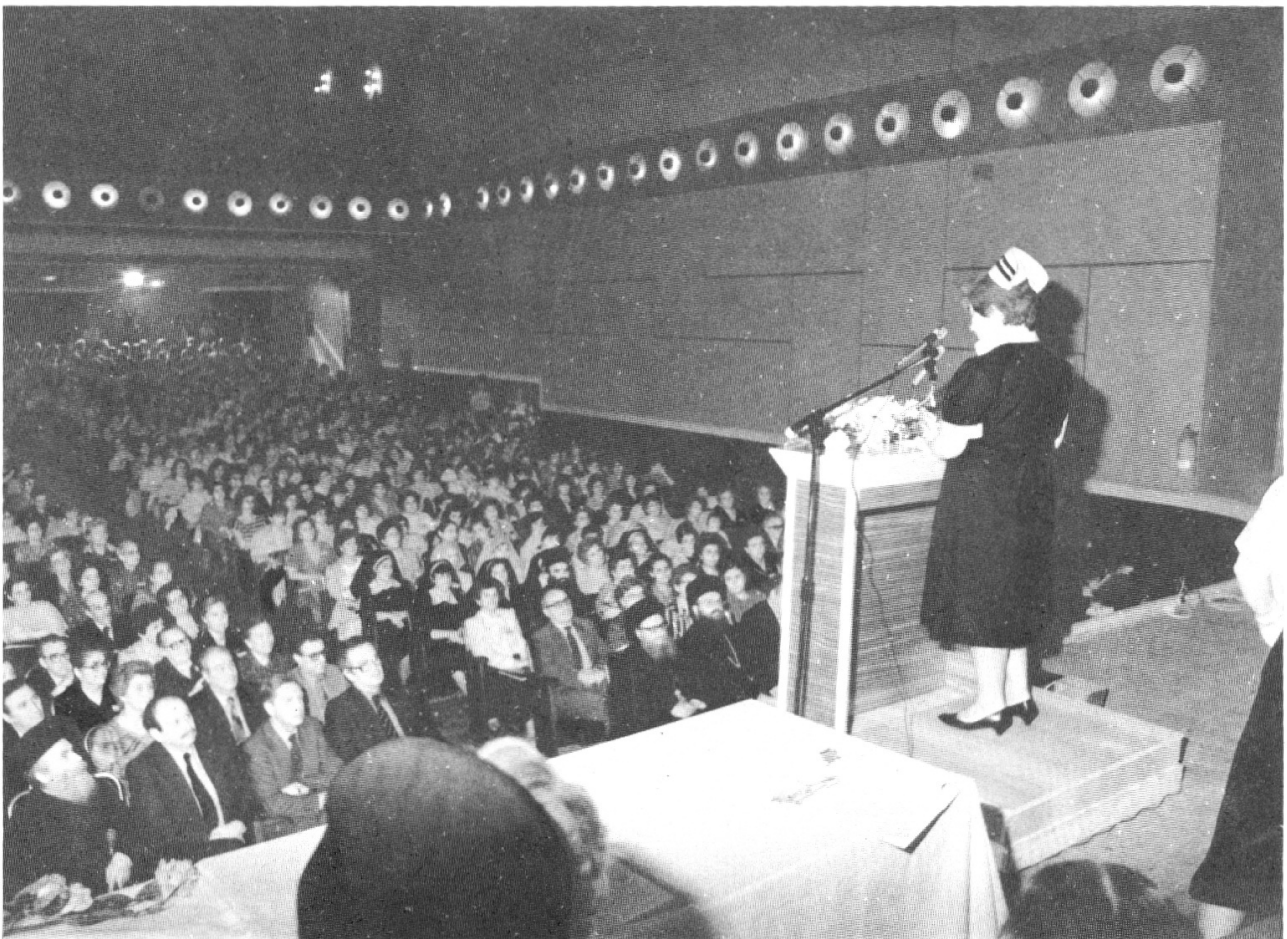
Εικόνα 1. Η Διευθύνουσα του Νοσοκομείου Σερρών προσφωνεί τους συνέδρους κατά την έναρξη του Συνεδρίου.