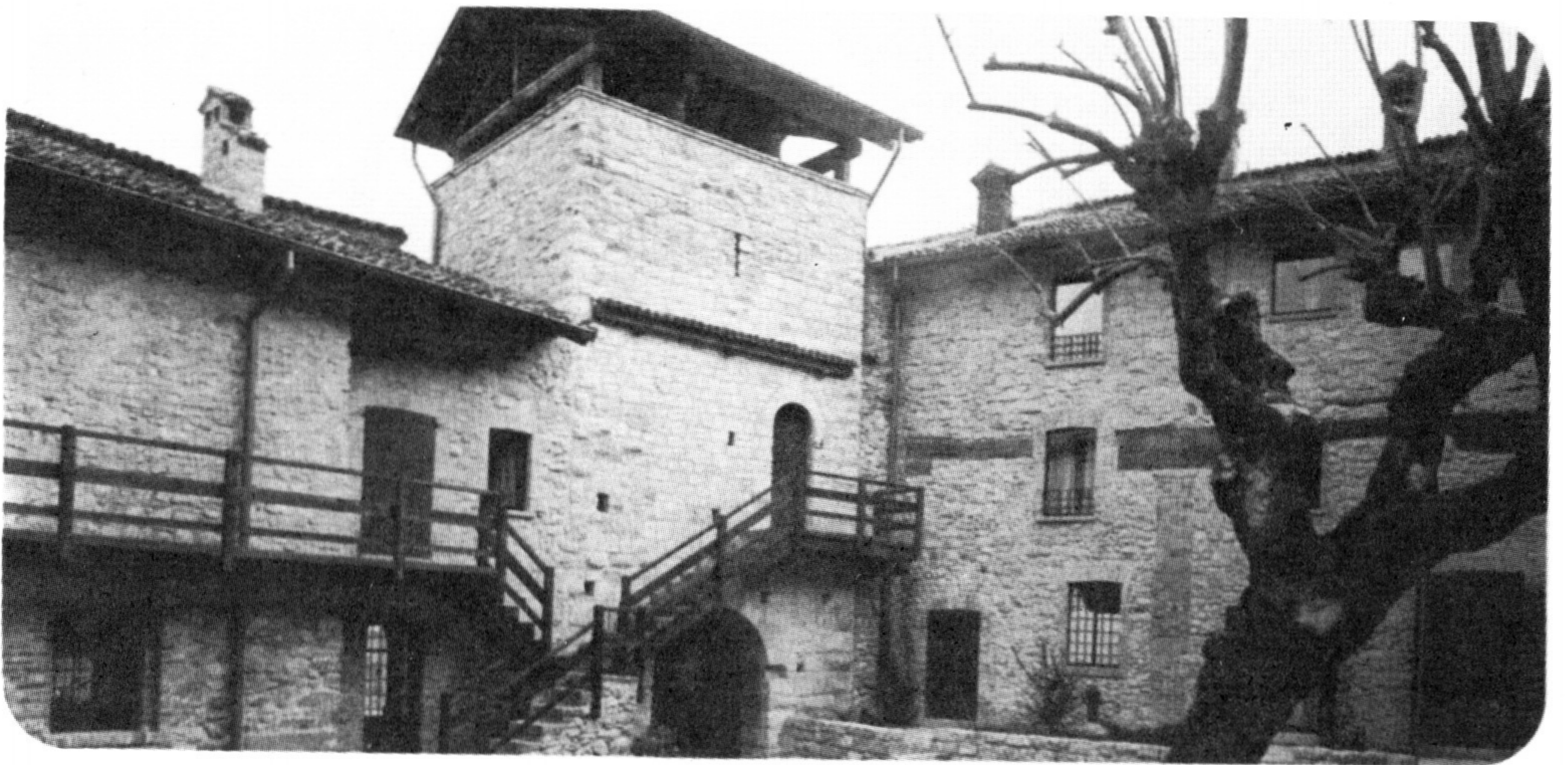
Εξωτερική και εσωτερική άποψη του Pomerio Castle