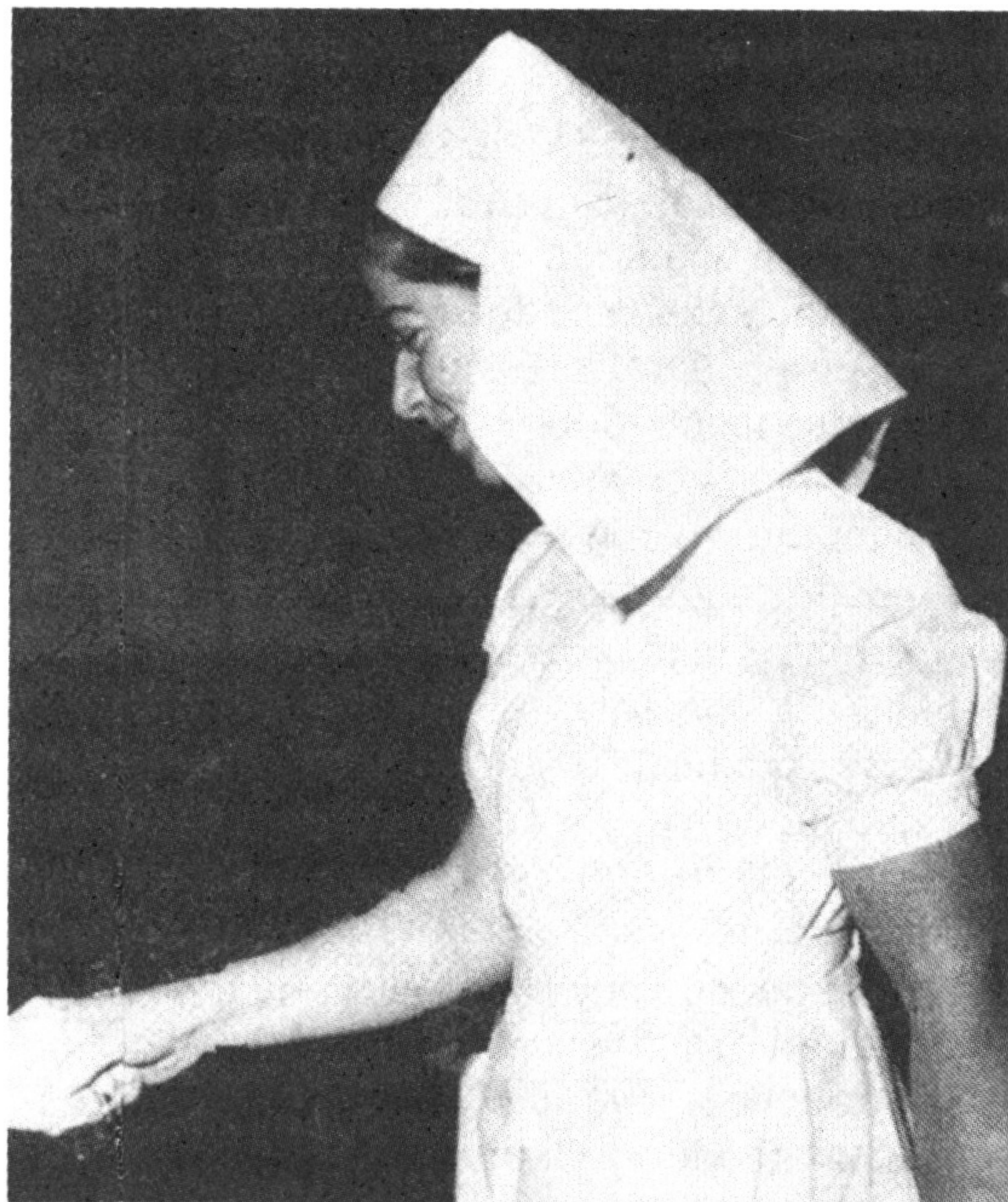
Εικόνα 1. Όραμα στο προσκεφάλι κάθε αρρώστου, κάθε τραυματία: η αδελφή. Με το χαμόγελο της καρτερίας, απλώνει το χέρι να προσφέρει ανακούφιση και σωτηρία.

Το καράβι έπλεε, πάντοτε άοπλο, κάτασπρο, φωταγωγημένο, με εμφανή τα σήματα του Ερυθρού Σταυρού, όπως επέβαλαν οι διεθνείς κανόνες.