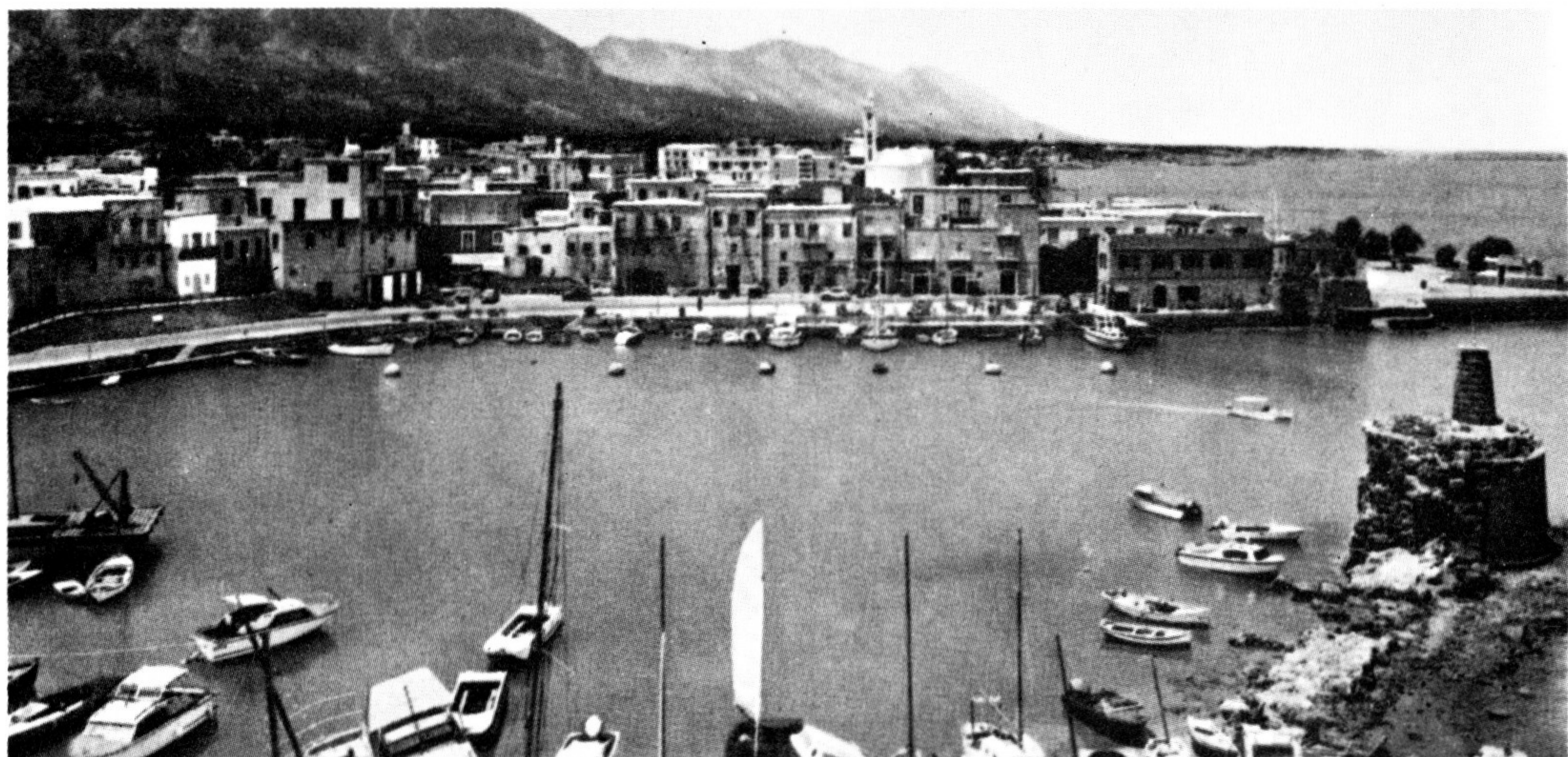
Ἡ ὀμορφή Κερύνια