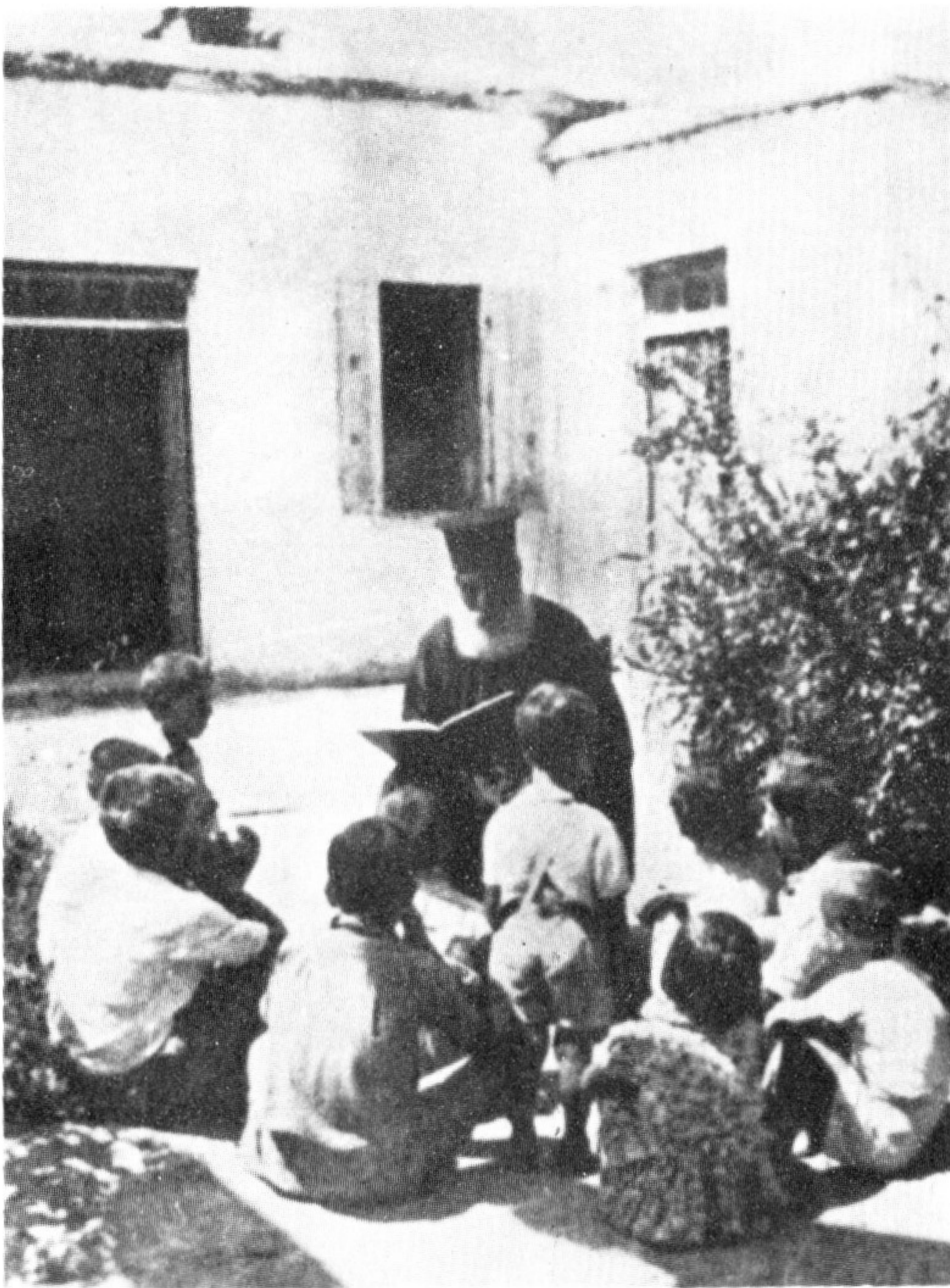
Ὁ «καλὸς ποιμὴν»

Σὰν δαίμονες ποὺ βγήκαν ἀπὸ τὴν κόλαση, ὥρμησαν οἱ Τοῦρκοι εἰσβολεῖς στὰ χωριά τῆς Κύπρου, ὅπου ἐπὶ ἡμέρες λεηλατοῦσαν καὶ σκότωναν χωρὶς διακρίσεις. Καὶ ὑπὸ τὴν ἐπήρεια οἰνοπνευμάτων, ποὺ ἔκλεβαν, ἔτρεχαν στοὺς δρόμους οὐρλιάζοντας καὶ πυροβολώντας. Ἐμπαιναν στὰ σπίτια λήστευαν, κατέστρεφαν, βασάνιζαν, ἀσχημονοῦσαν καὶ δημιουργοῦσαν ἓνα πρωτοφανὲς πανδαιμόνιον τρόμου, θανάτου καὶ ἀπερίγραπτης φρίκης.