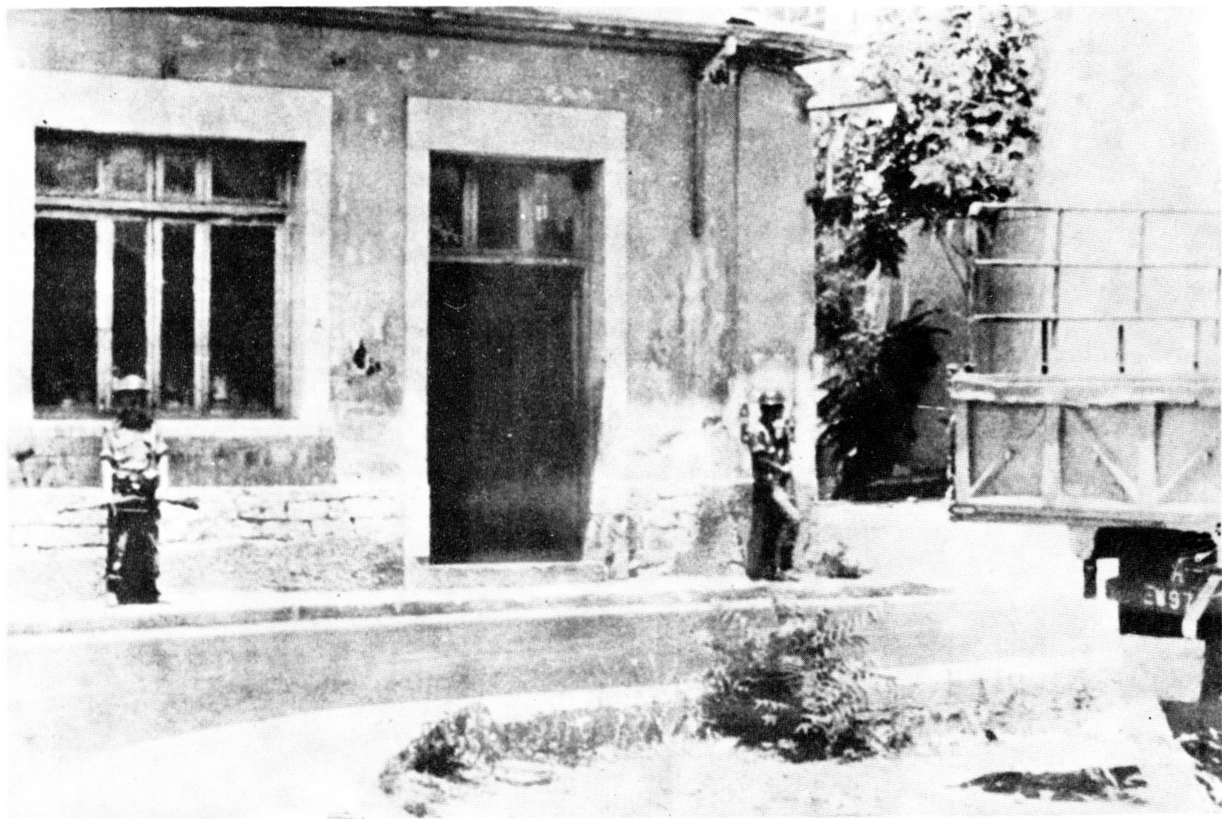
Οἱ Τοῦρκοι εἰσβάλλουν στὴν Κύπρο.

Ἡ μαχητικότης των κατὰ τὴν εἰσβολὴ τοῦ τουρκικοῦ στρατοῦ στὰ Κυπριακὰ παράλια, προσέθεσε νέες λαμπρὲς σελίδες πολεμικῆς Ἀρετῆς