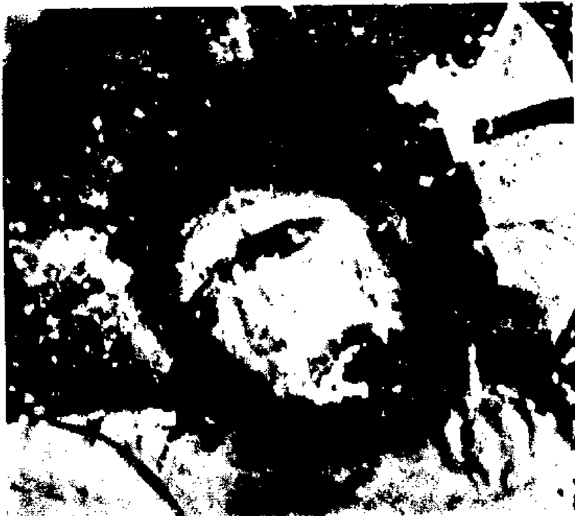
5. «Σταύρωση» του 9ου αι. Λεπτομέρεια της κεφαλής του Χριστού στην υπέρυθρη περιοχή.