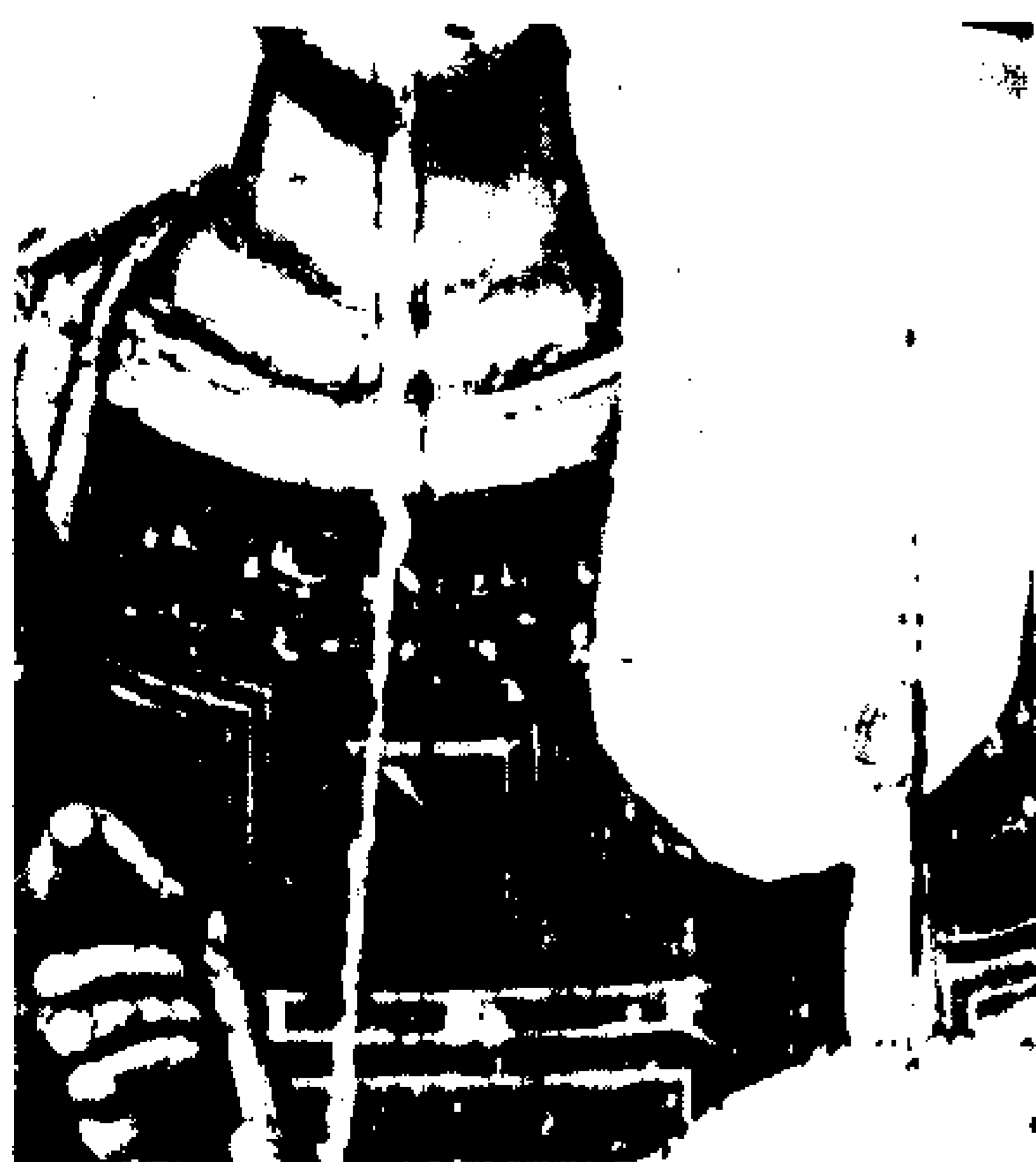
12. «Άγιος Γεώργιος» του 14ου αι. Λεπτομέρεια του θώρακα στην υπέρυθρη περιοχή.

Το πλήθος και η αξία των συλλεγομένων παρατηρήσεων (αποκάλυψη αρχικού σχεδιαστικού σκαριφήματος, επιζωγραφήσεων, επεμβάσεων, η κατ' αρχήν ταυτοποίηση των χρωστικών κ.λ.π.), όπως ήδη διαπιστώθηκε από τα παραδείγματα που παρουσιάστηκαν, προσδίδουν στην μέθοδο κάποιο χαρακτήρα αυτονομίας.