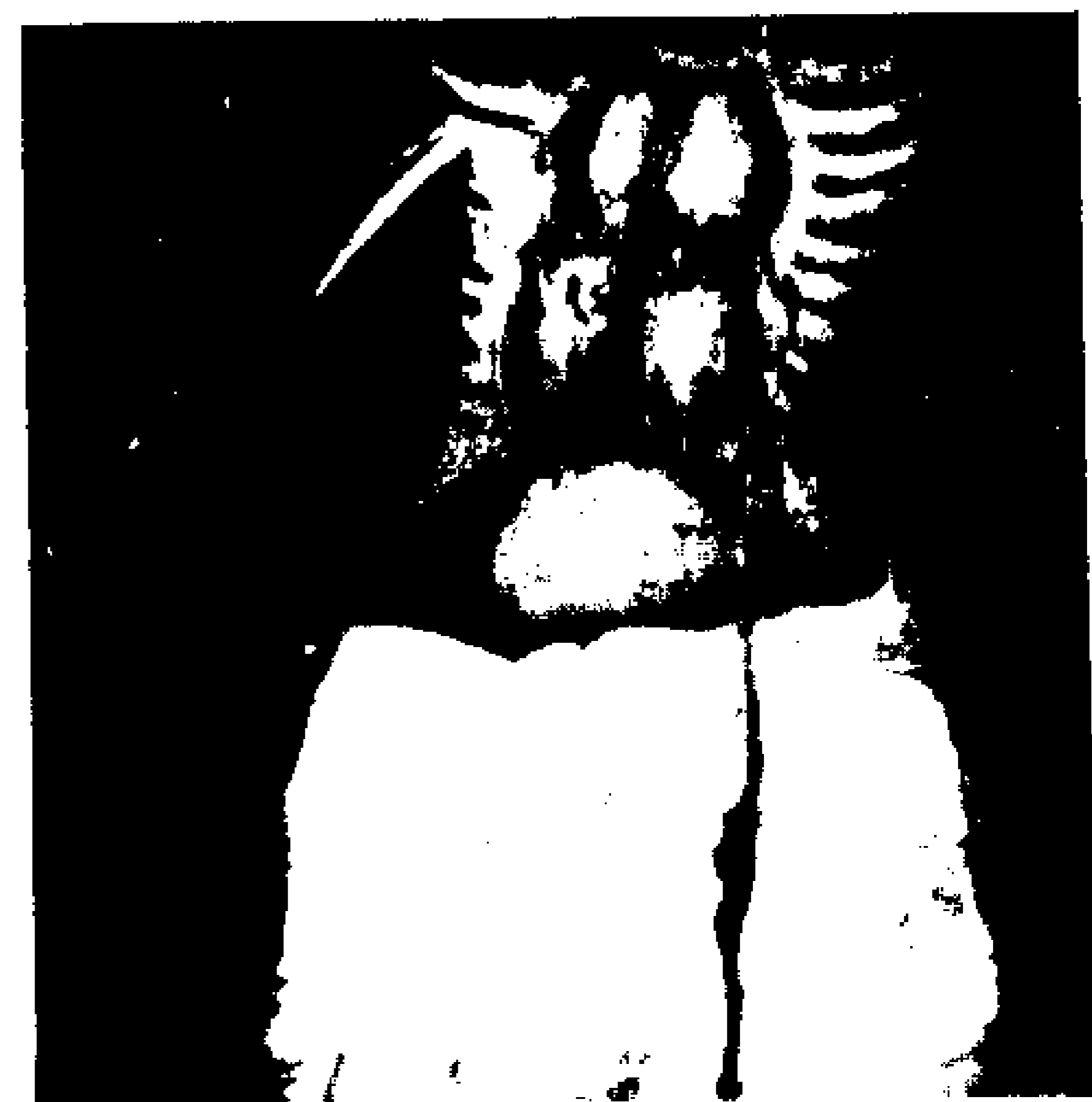
9, 10, 11. «Σταύρωση» του 18ου αι. Λεπτομέρεια του χιτώνα του Ιωάννη, της Παναγίας και του περιζώματος του Χριστού, αντίστοιχα, στην υπέρυθρη περιοχή.