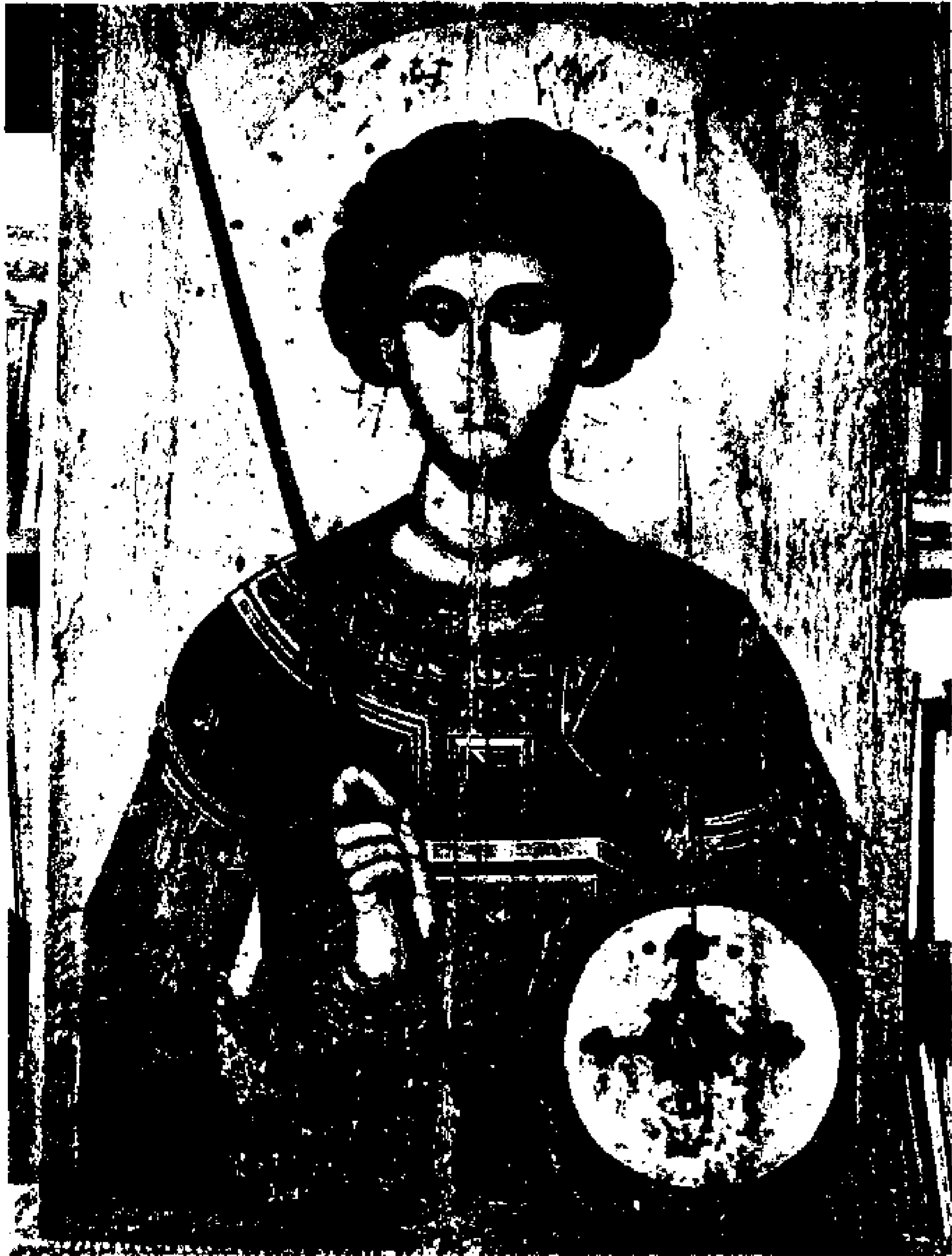
3. «Άγιος Γεώργιος» του 14ου αι. Φωτογραφία στο ορατό.