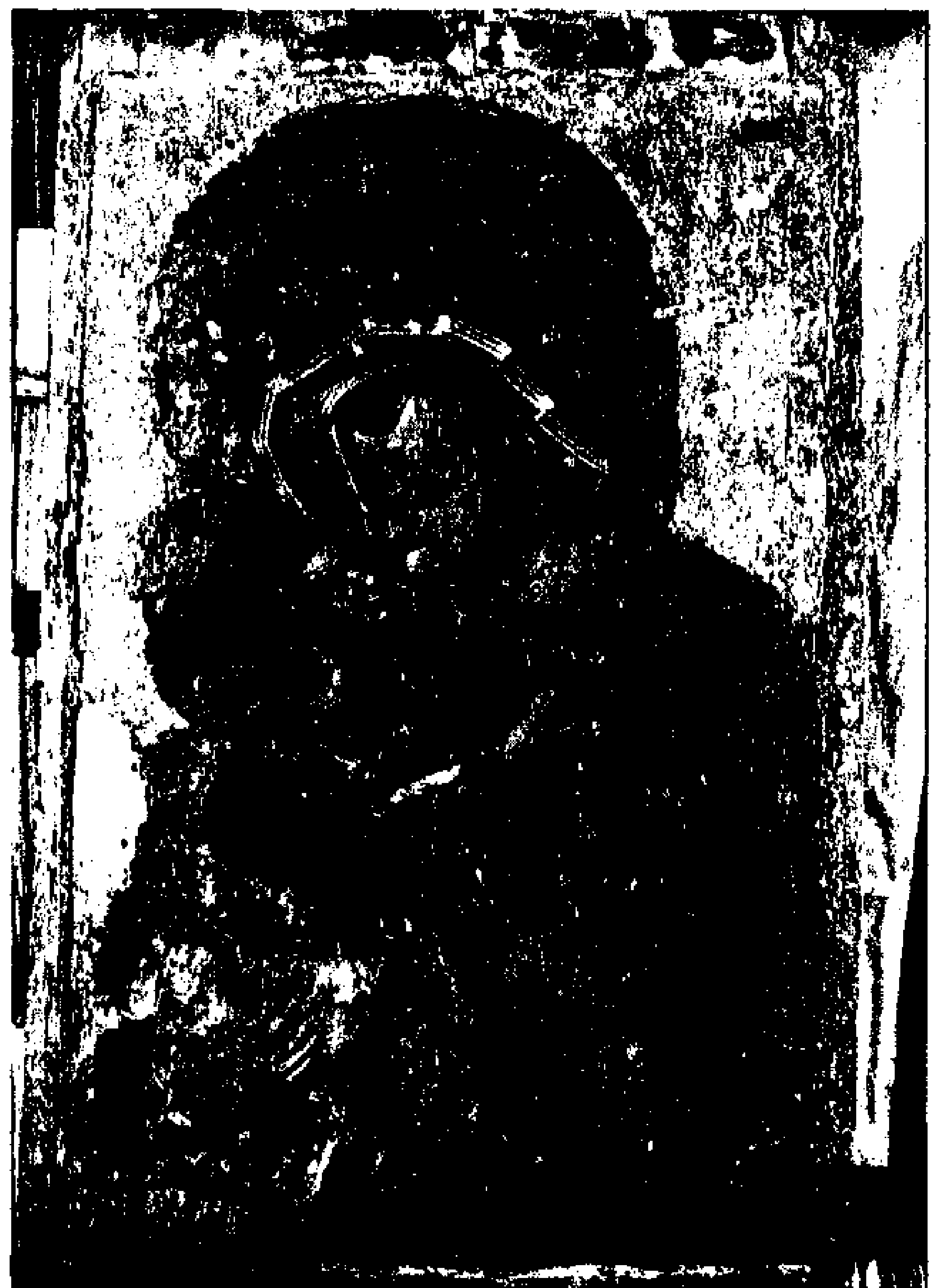
2. «Παναγία Βρεφοκρατούσα». Εικόνα προερχόμενη από τη Βέροια, του 14ου αι. Φωτογραφία στο ορατό.

βδου και οξειδίου του μολύβδου (vidicon) με δυνατότητα ανίχνευσης ακτινοβολιών μήκους κύματος μέχρι περίπου τα 2200 nm, και από μία οθόνη υψηλής διακριτικής ικανότητας (monitor).