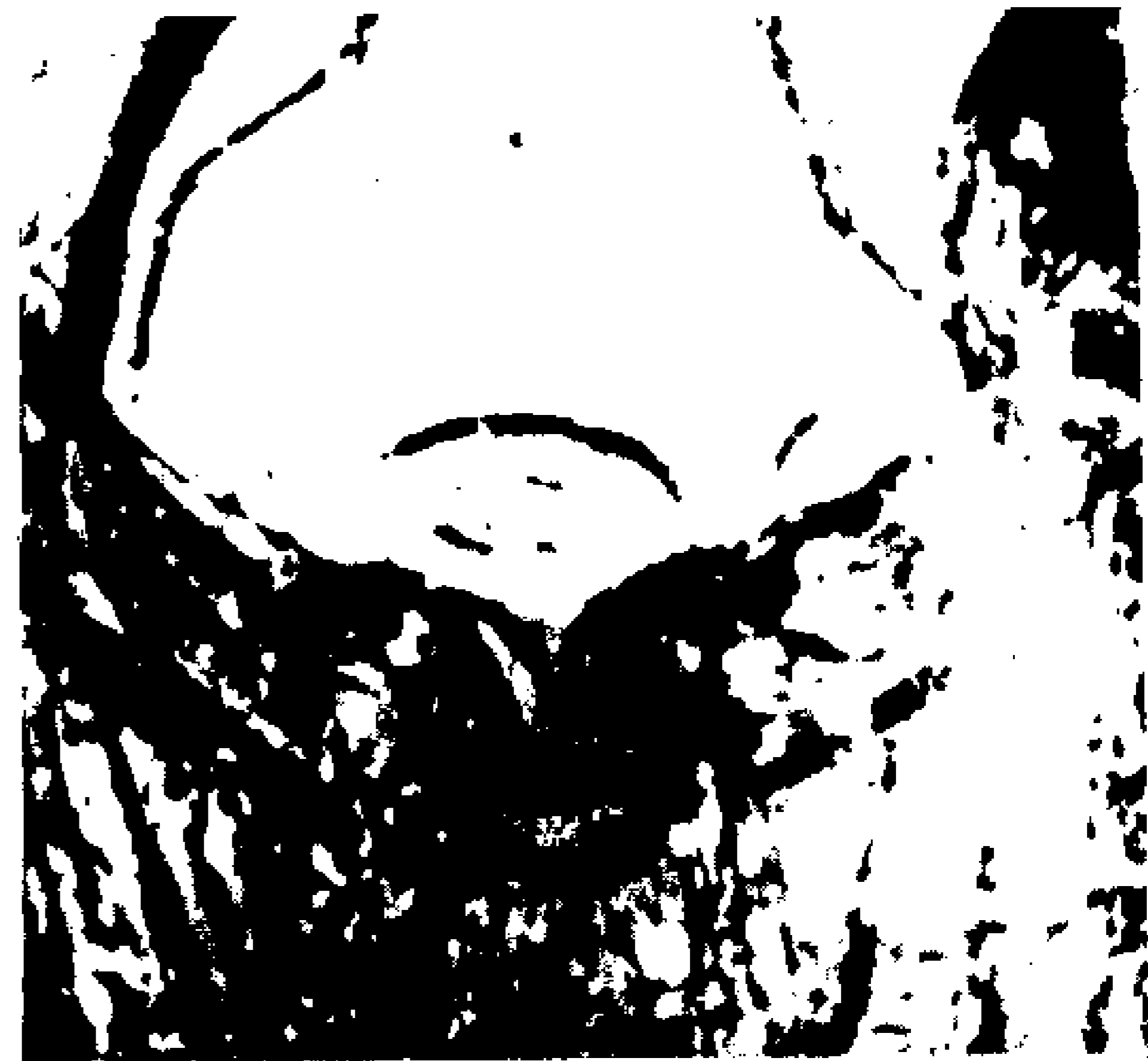
7. «Σταύρωση» του 9ου αι. Λεπτομέρεια του Σώματος του Χριστού στην υπέρυθρη περιοχή.

φανειακά. Η ύπαρξη παλαιότερης παράστασης κάτω από τα επιφανειακά χρωματικά στρώματα επιβεβαιώνεται εξ άλλου με την αποκάλυψη μιας δεύτερης μορφής (διακρίνεται η κεφαλή και το φωτοστέφανο, εικ. 6) στο ύψος του αριστερού χεριού του Ιωάννη, γεγονός που εξηγεί άλλωστε την παρουσία του μικρού χεριού που φαίνεται να εξέρχεται αριστερά από το ιμάτιο του Ιωάννη.