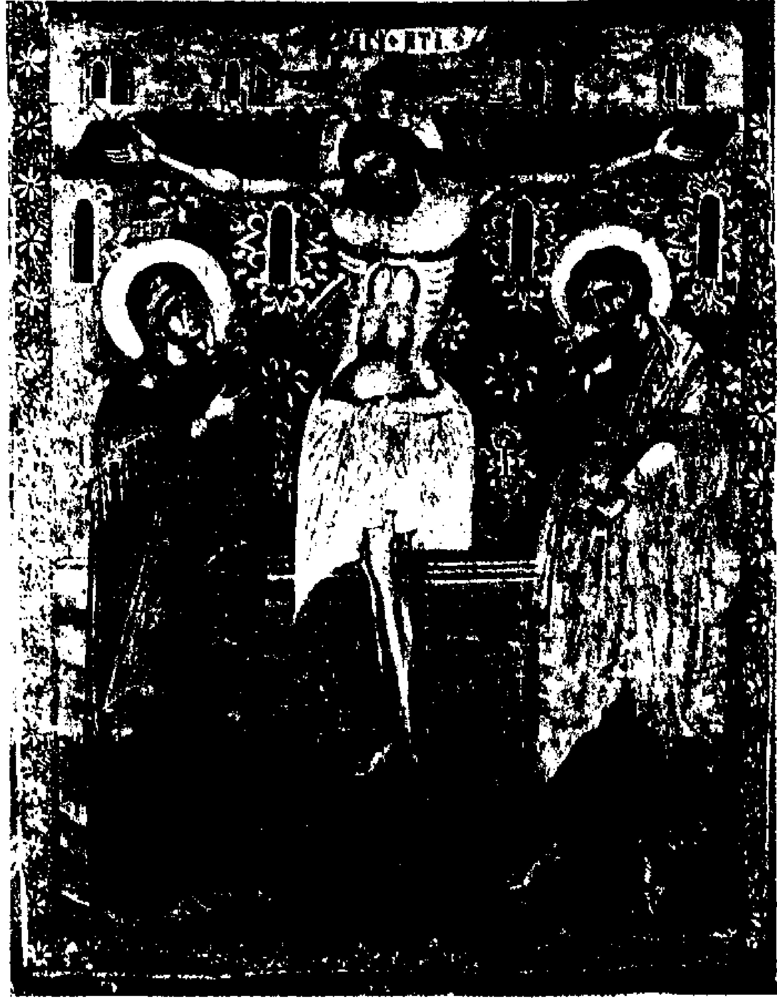
4. «Σταύρωση» του 18ου αι. Φωτογραφία στο ορατό.

επιστημών στην προσπάθεια αναζήτησης της ιστορικής αλήθειας.