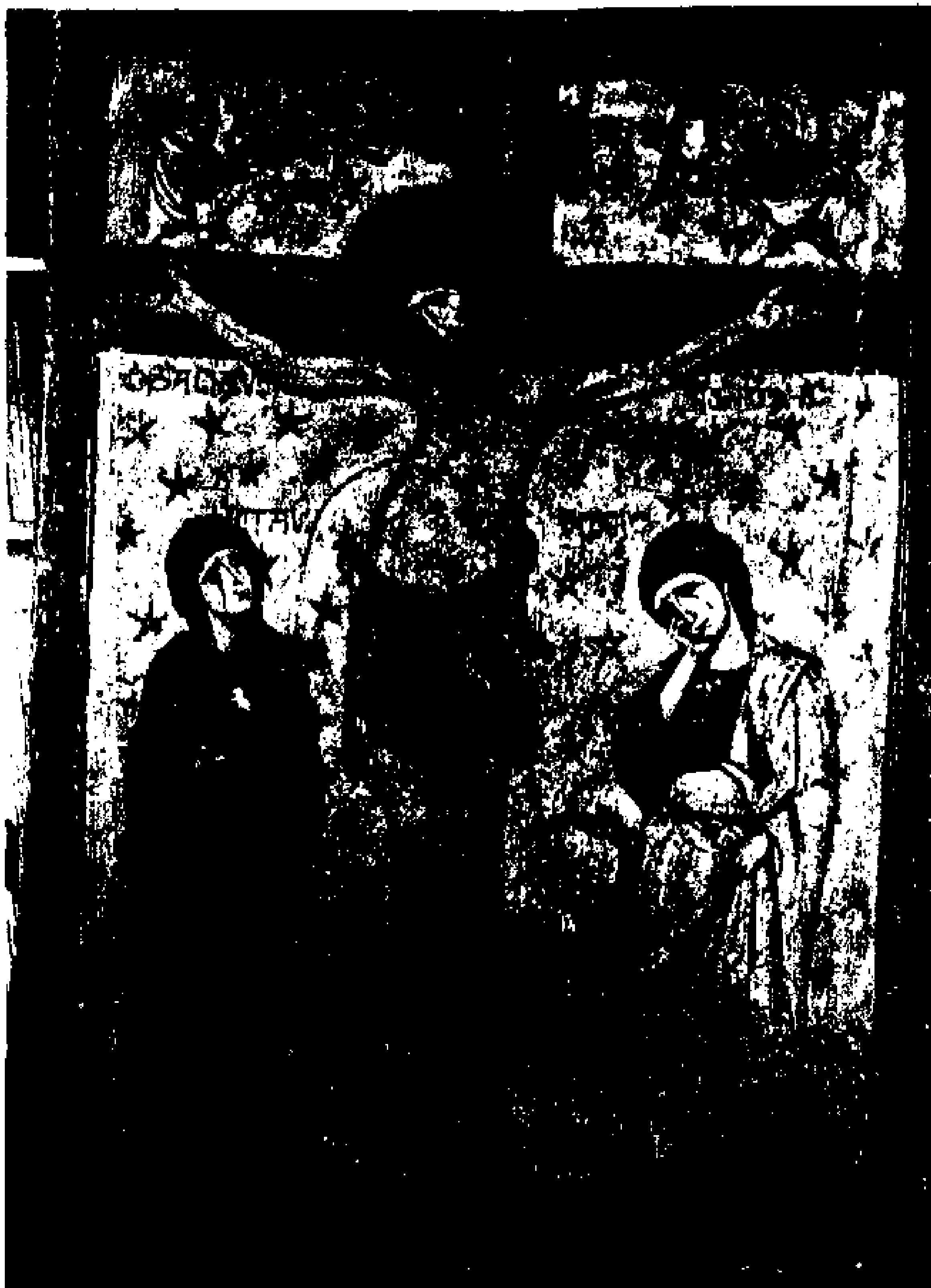
1. «Σταύρωση» Εικόνα με τρία στρώματα ζωγραφικής (9ος, 10ος, 13ος αι.). Φωτογραφία στο ορατό.