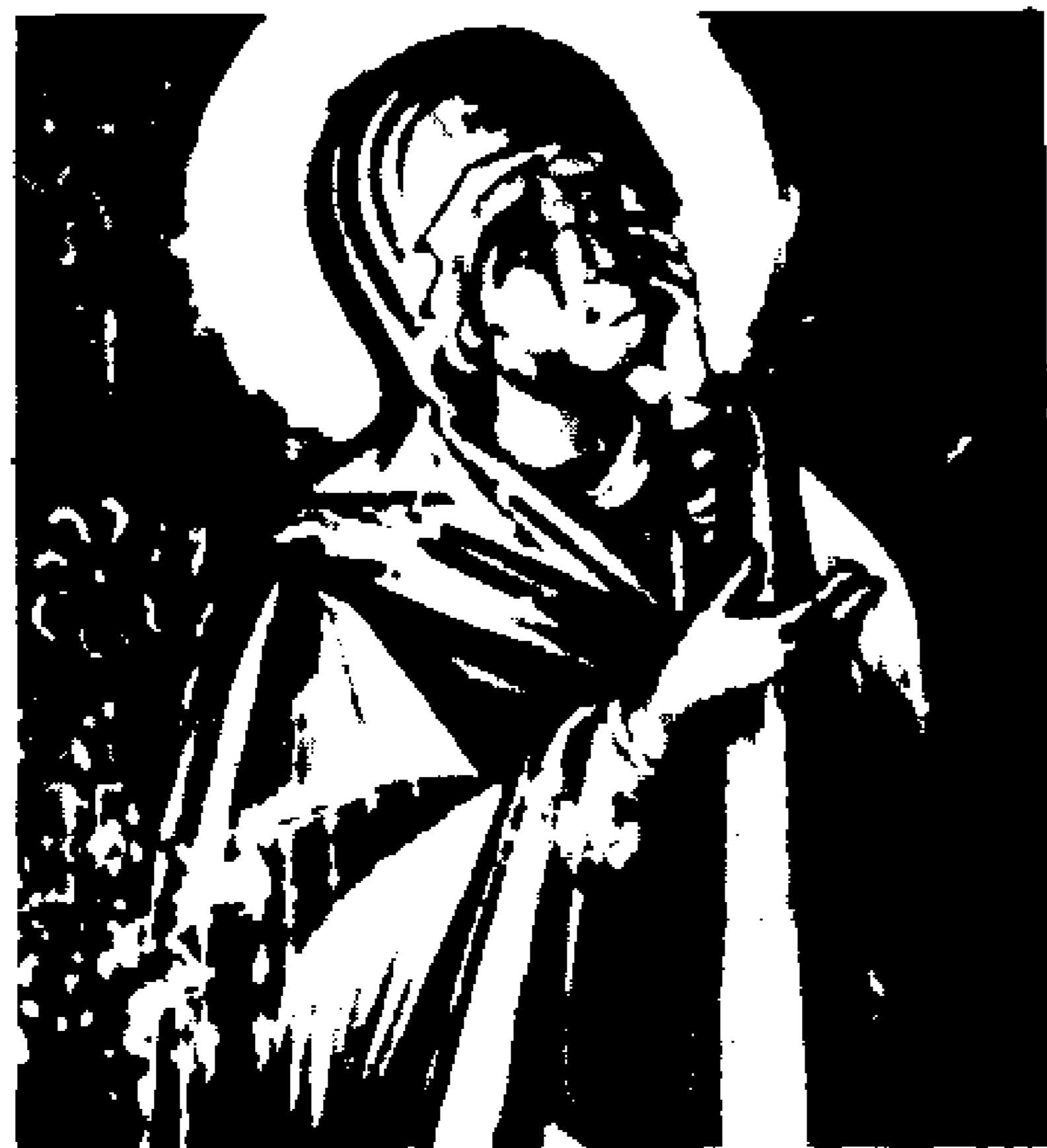
13. «Σταύρωση» του 18ου αι. Λεπτομέρεια του περιζώματος του Χριστού και του ιματίου της Παναγίας αντίστοιχα, στην υπέρυθρη περιοχή.