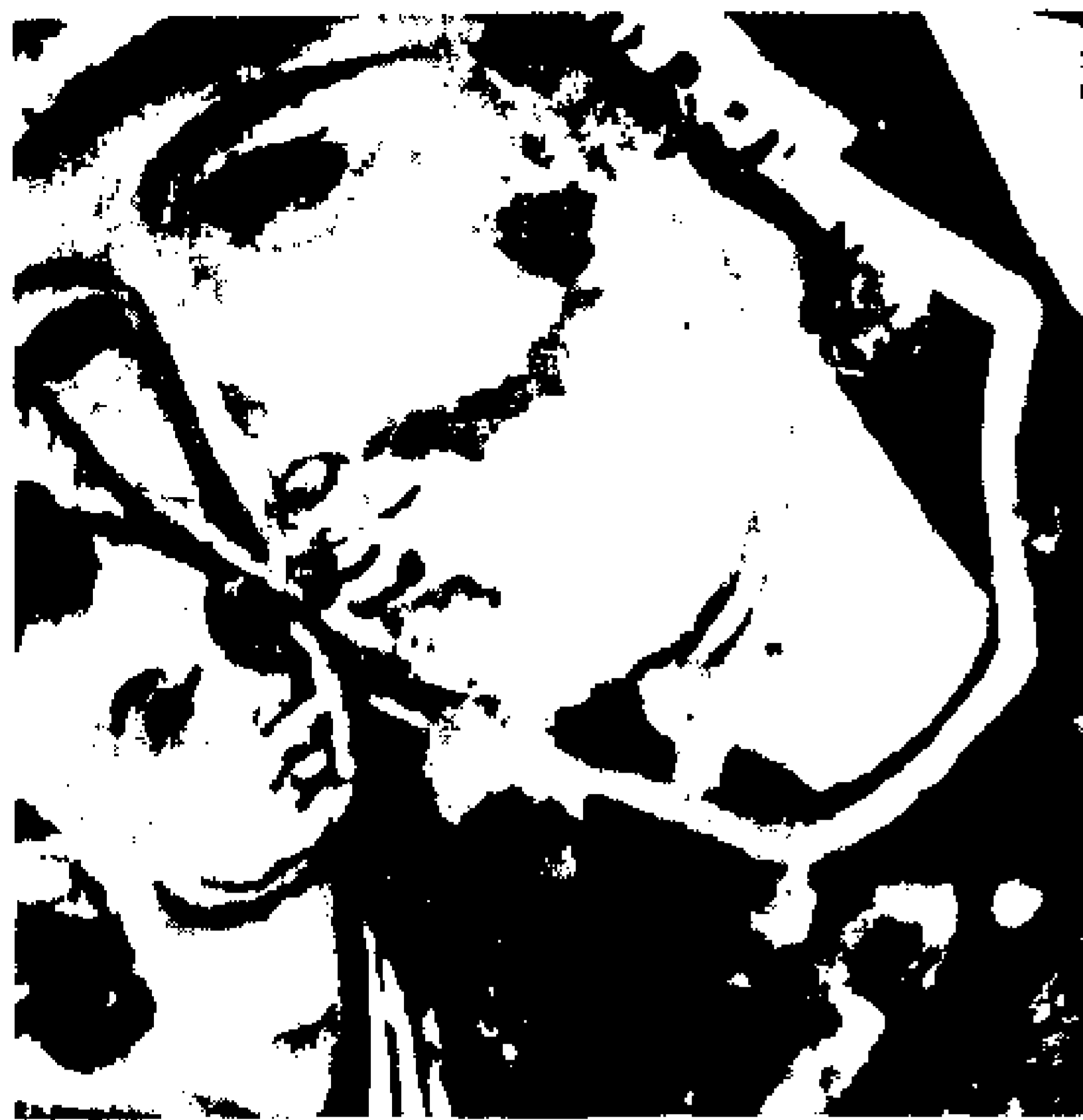
8. «Παναγία Βρεφοκρατούσα» του 14ου αι. Λεπτομέρεια στην υπέρυθρη περιοχή.

κότητά τους σε αιματίτη (οξειδίο του σιδήρου), έτσι ώστε να παρουσιάζουν όλες τις διαβαθμίσεις των τόνων του γκρι, από τις ανοικτότερες (περίπτωση περιζώματος του Χριστού, εικ. 11) μέχρι τις σκουρότερες (περίπτωση του ιματίου της Παναγίας, εικ. 13).