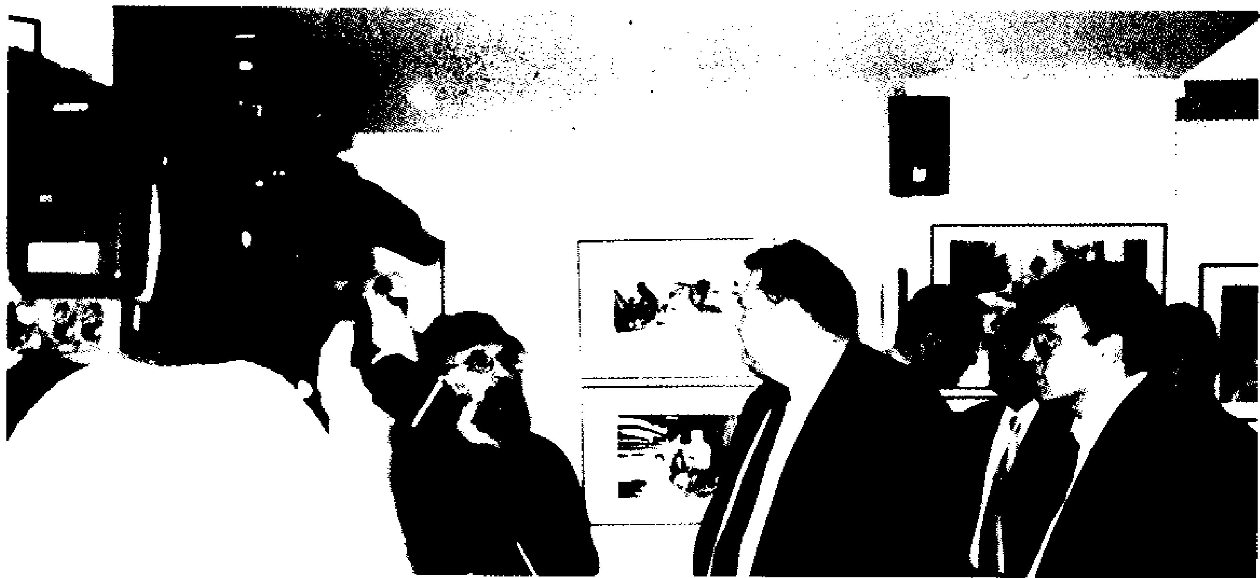
Ο Υπουργός Πολιτισμού κ. Ευάγγελος Βενιζέλος εγκαινιάζει την έκθεση «5 Έλληνες Δημιουργοί», στα πλαίσια των εκδηλώσεων «New Balkan Photography» στη Θεσσαλονίκη, Οκτώβρης 2002.

μέσα σου είναι τέχνη. Για να φτάσεις στο επιθυμητό επίπεδο, θα χρειαστεί σκληρή εργασία και θα απαιτηθεί χρόνος και χρήμα. Σιγά-σιγά, ίσως να μπορέσεις να εκφράσεις τις επιθυμίες σου, που τις είχες κρύψει βαθιά μέσα σου μέχρι την ημέρα της πραγματοποίησής τους.