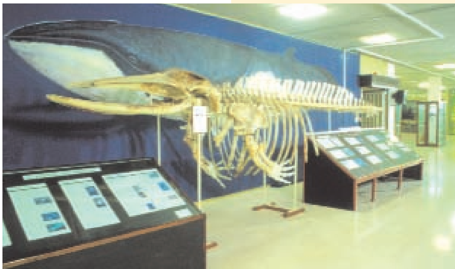
Εικ. 1. Ζωολογικό Μουσείο Πανεπιστημίου Αθηνών.

Μάνος Μικελάκης Υπ. Δρ. ΕΜΠ - Αρχαιολόγος