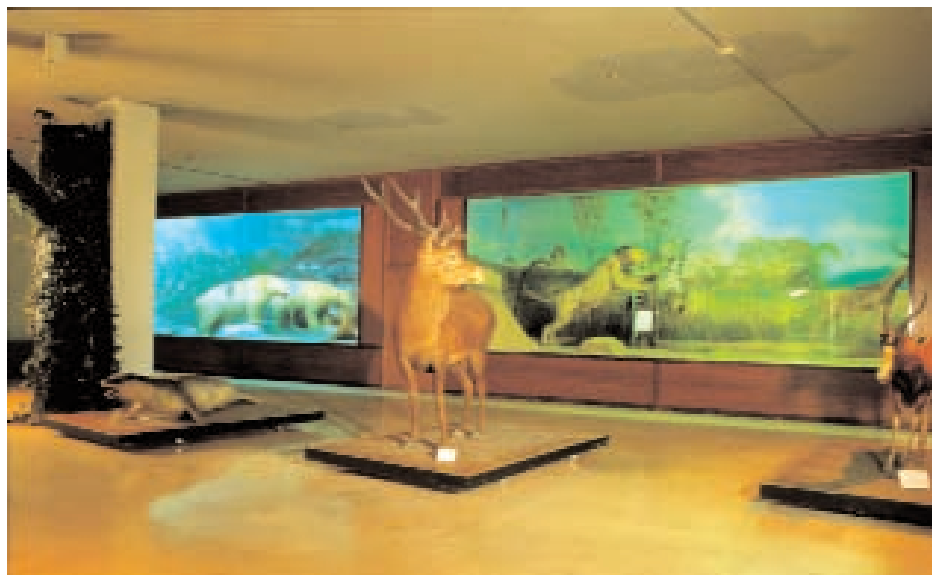
Εικ. 2. Ζωολογικό Μουσείο Πανεπιστημίου Αθηνών.

Τέλος, το Εικονικό Μουσείο, διαφοροποιούμενο από τις αντίστοιχες οικοσελίδες των Πανεπιστημιακών μουσείων, αναδεικνύει τη δυνατότητα εφαρμογής των νέων τεχνολογιών και των πολυμέσων στη μουσειακή εκπαίδευση. Στόχος του είναι η διαμόρφωση ενός ενιαίου εικονικού περιβάλλοντος για όλα τα μουσεία, ενός πολυγλωσσικού, πολυμεσικού δικτυακού τύπου, ο οποίος θα συμβάλλει στην ενημέρωση των χρηστών και την