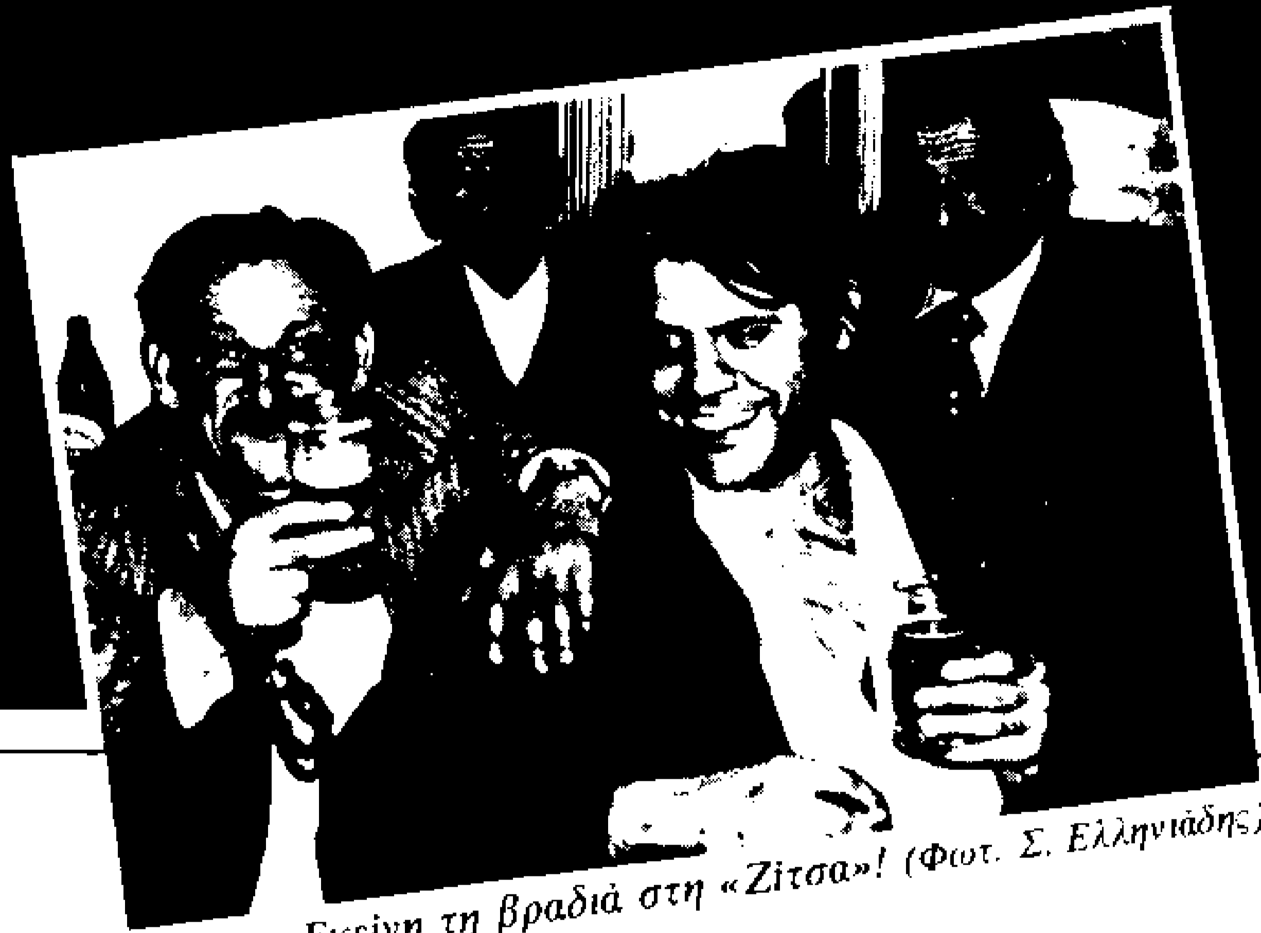
Εκείνη τη βραδιά στη «Ζίτσα»!