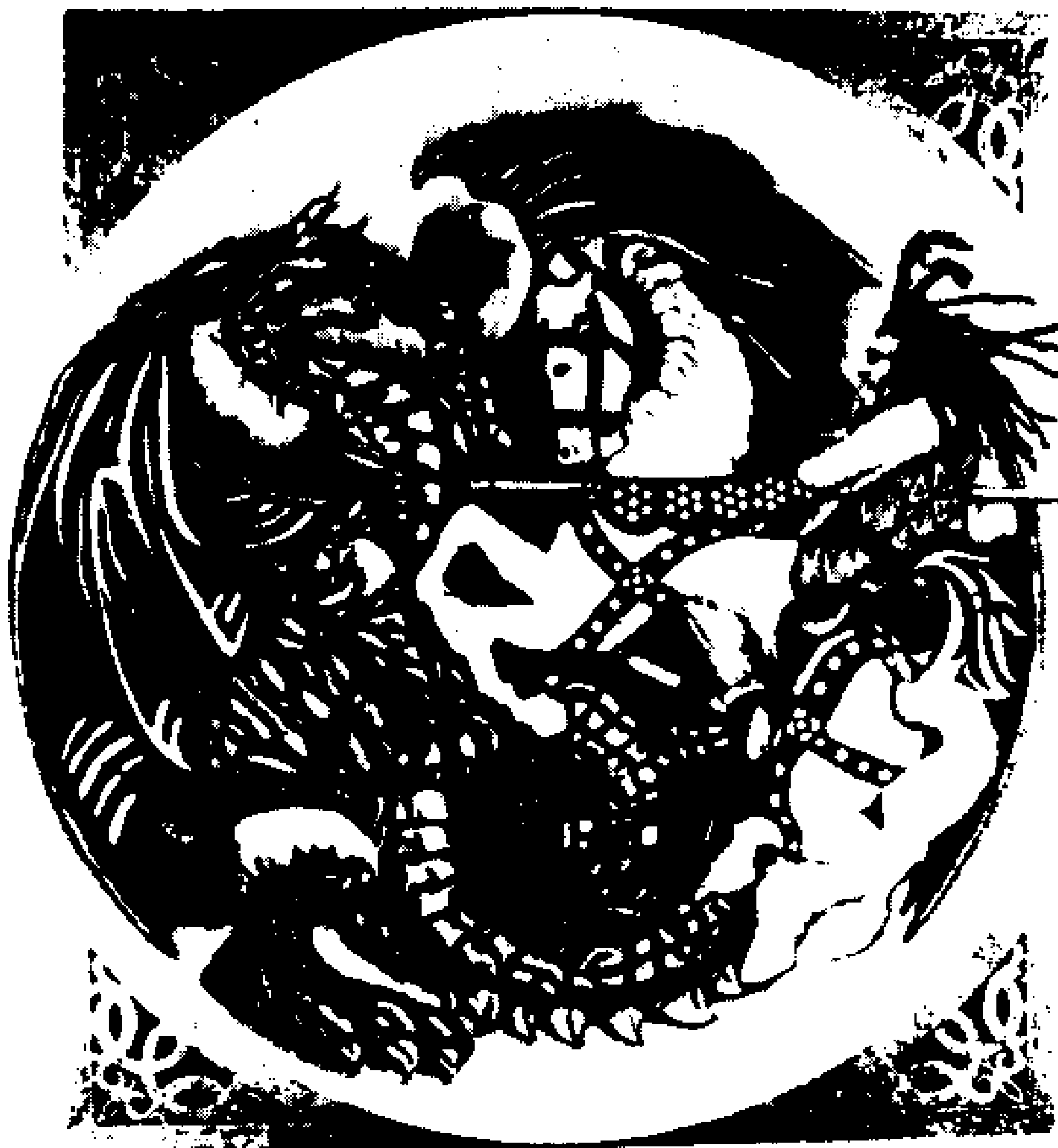
BOB MARLEY & THE WAILERS CONFRONTATION