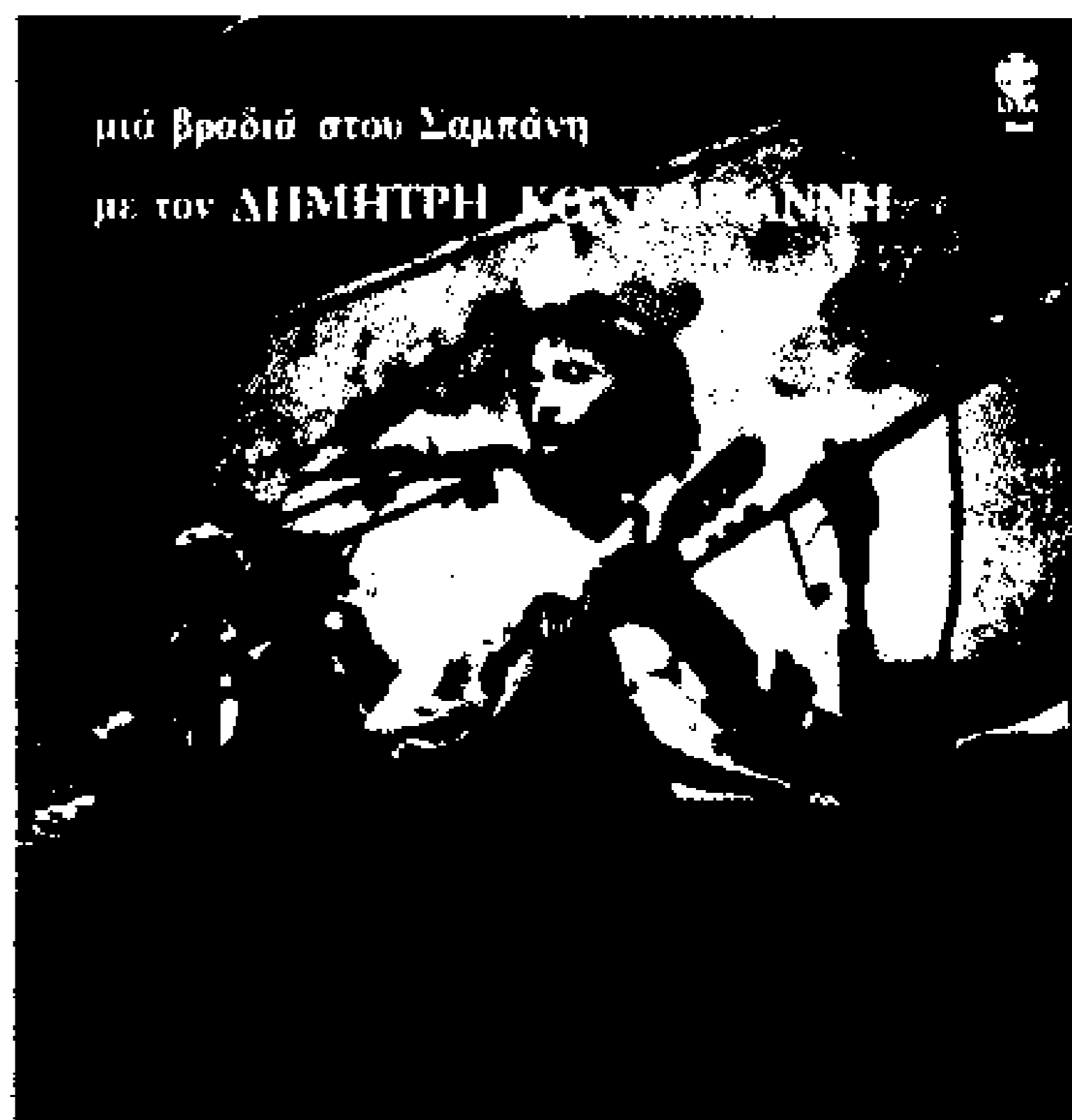
μιά βραδιά στο Σαμπάνη