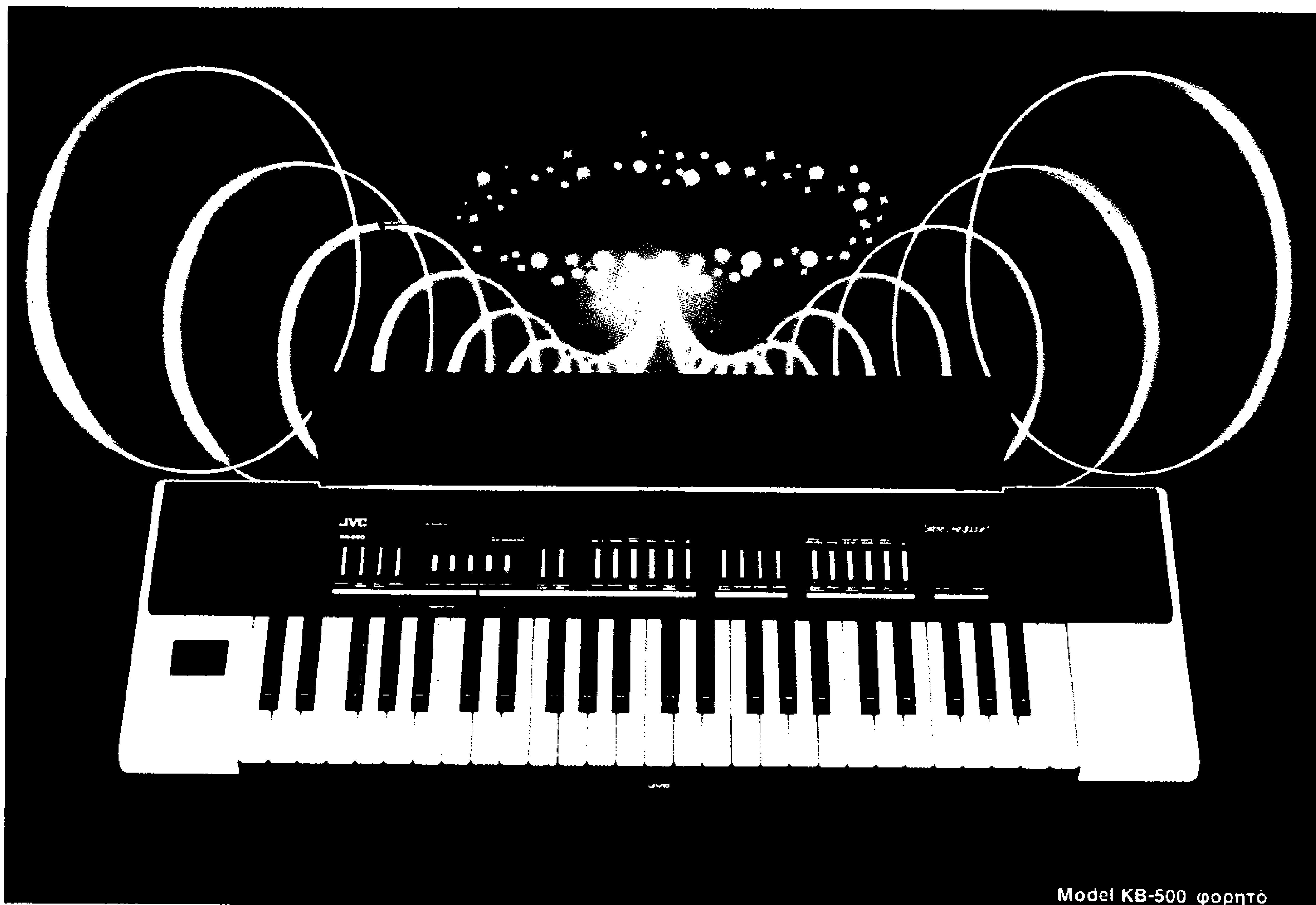
Model KB-500 φορητό