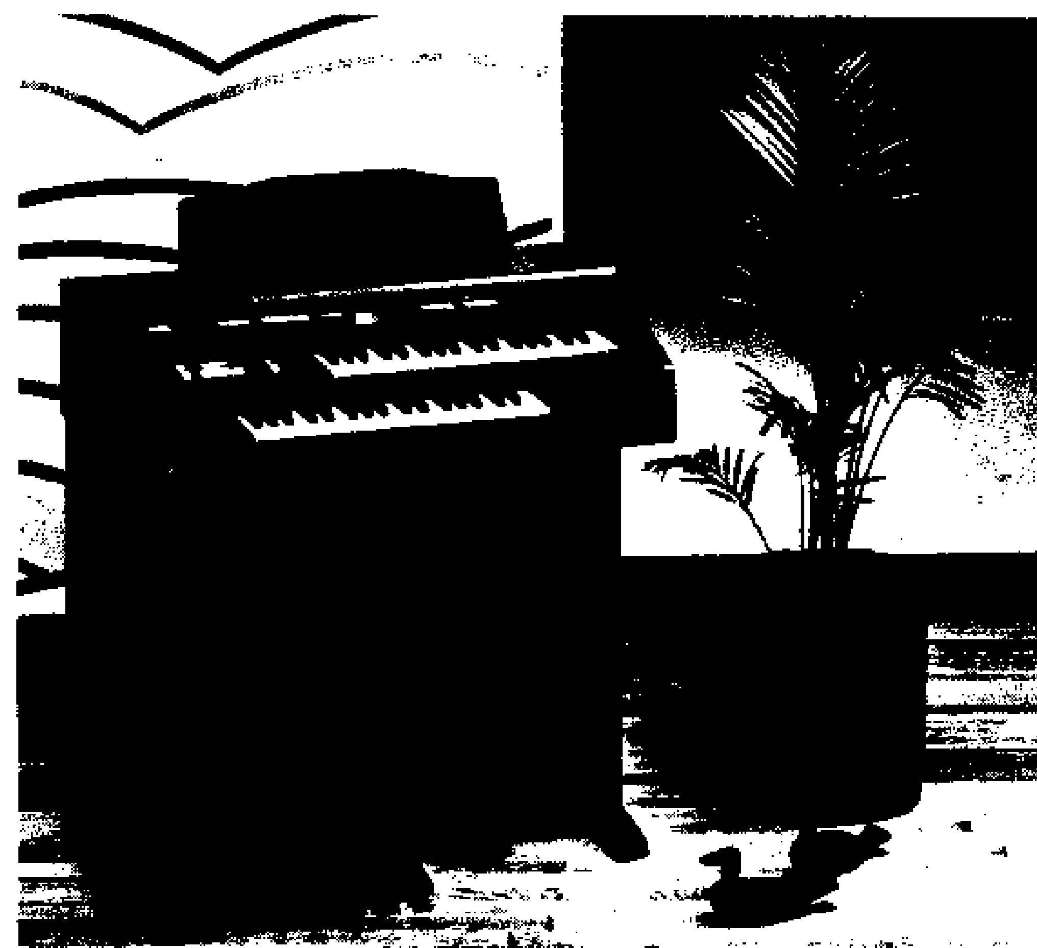
Model G - 250/350

KB - 500 Ισχύς 5 watt stereo, 10 ρυθμοί, 10 χαρακτηριστικοί τόνοι, 49 πλήκτρα. Υποδοχές: πεντά, μικρόφωνο, ακουστικά AUX. Δυνατότητα απομνημόνευσης τριών επιλογών compucorder