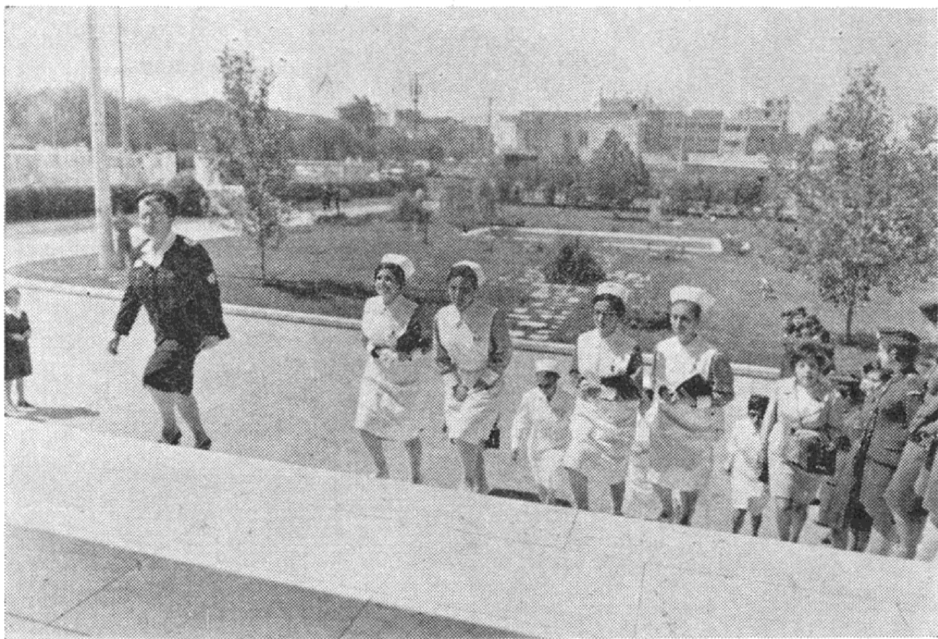
Εἴσοδος Ἀδελφῶν εἰς τὴν Πάντειον

Ἡ ἴδρυσις τοῦ ἐντευκτηρίου τῶν Ἀδελφῶν εἶναι ἀπαραίτητος διὰ νὰ βοηθῆται ἡ Ἀδελφή εἰς τὰ ἐπαγγελματικά της προβλήματα καὶ διὰ τὴν στενὴν ἐπαφὴν μεθ' ὄλων τῶν Ἀδελφῶν καθὼς καὶ μετὰ τῶν ἐκ τῶν ἐπαρχιῶν.