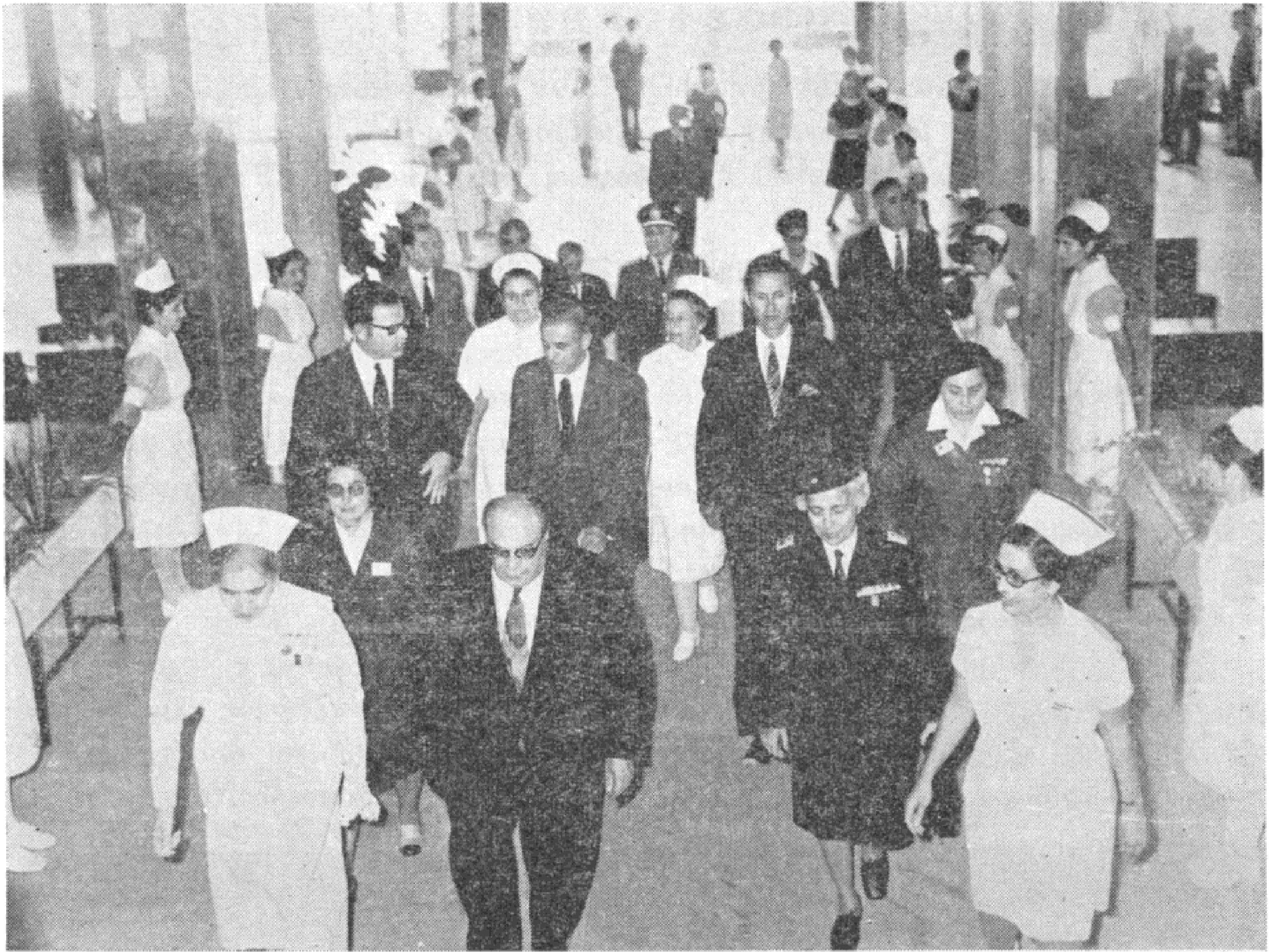
Ἀπὸ τὴν προσέλευσιν τῶν ἐπισήμων εἰς τὸ Συνέδριον