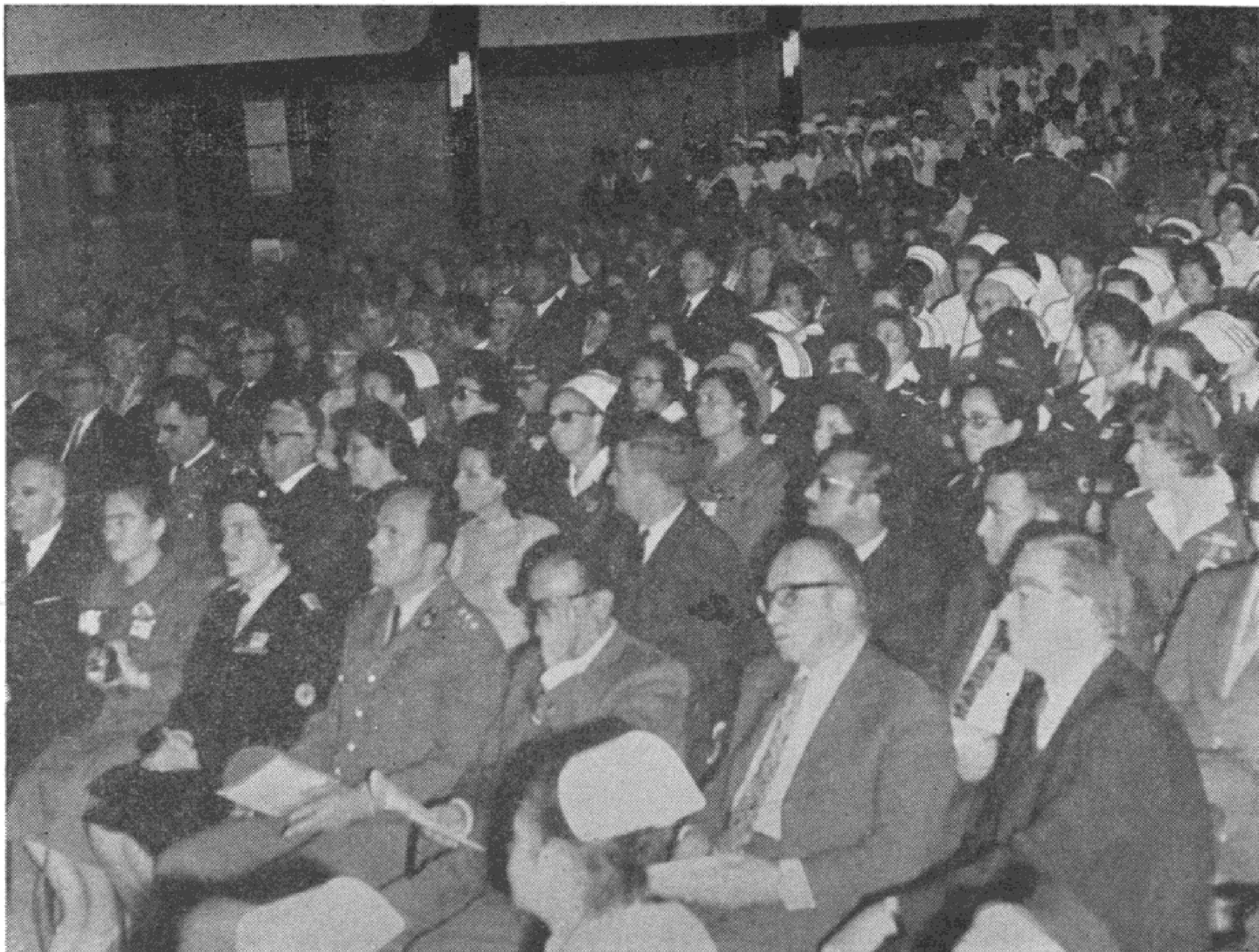
Στιγμιότυπον ἀπό τήν ἐναρκτήριον συνεδρίασιν

Ὡς Δήμαρχος τῆς Θεοφρουρήτου πό- λεως τοῦ Ἁγίου Δημητρίου, ἡ ὁποία ἀπό τῆς ἀπελευθερώσεώς της δέχεται συνεχῶς τήν εὐεργετικήν ἐπίδρασιν τῆς θερμῆς σας παρουσίας εἰς τόν χῶρον τῶν πασχόντων, χαιρετίζω τό συνέδριόν σας και εὐχομαι ὁ- λοφύχως εὐόδωσιν τῶν ἐργασιῶν αὐτοῦ πρὸς τό καλόν τῆς τε πόλεώς μας και τοῦ Ἔθνους.