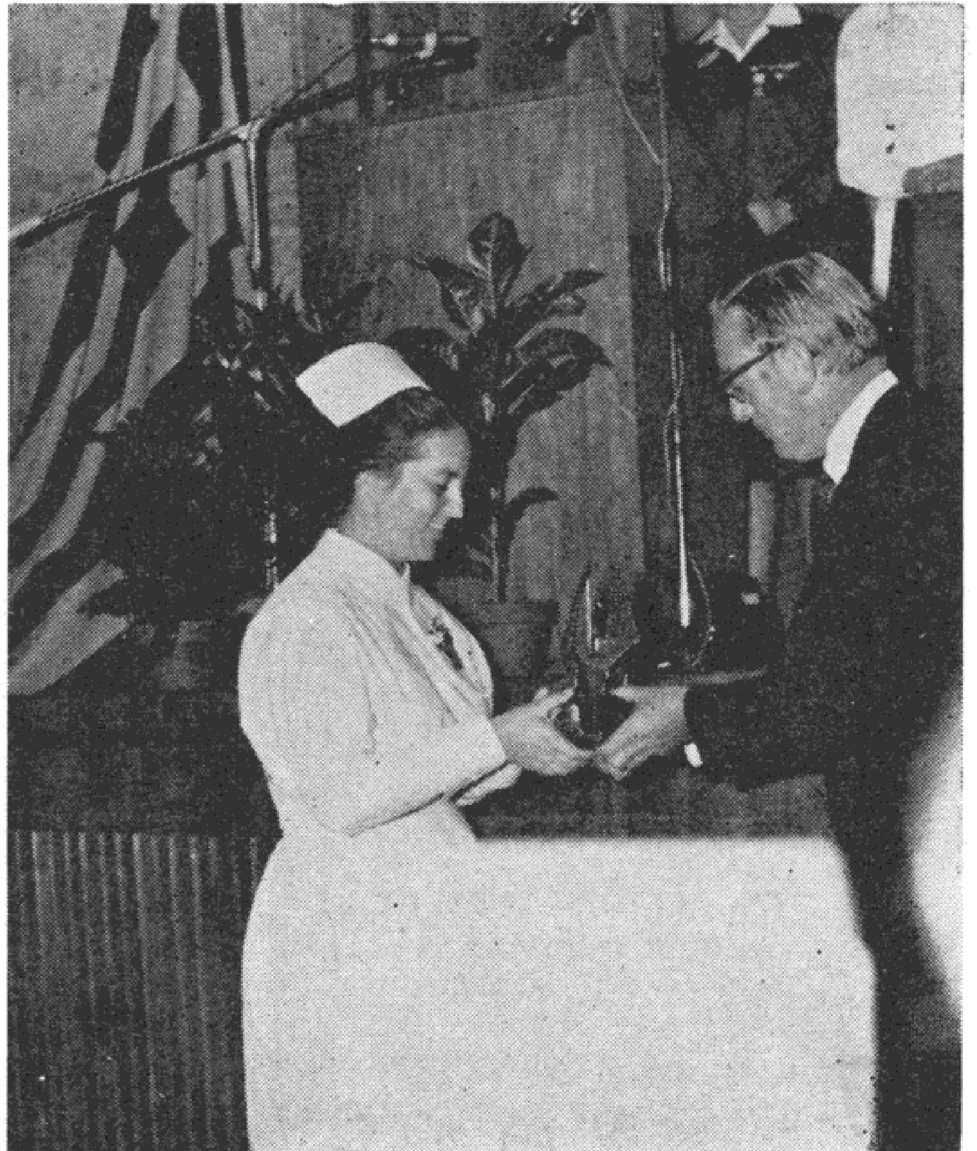
Η άπονομή επάθλου εις την άπόφοιτον τής Σχολής Άδελφών του Εύαγγελισμού και Βοηθόν Διευθυνούσης Άδελφής του Θεραπευτηρίου «Ο Εύαγγελισμός» υπό του κ. Πήτερ Κρούν, γενικού Διευθυντού τής έν Ελλάδαδι Άμερικανικής Έταιρίας 3.Μ

Έν συμπεράσματι, τας ήμέρας αυτές ήσχολήθημεν με τό θεωρητικόν μέρος τής όργανώσεως και διοικήσεως των νοσηλευτικών ύπηρεσιών, με τους διαφόρους τρόπους βελτιώσεως τής εργασίας μας και τά προβλήματα τά συναντώμενα κατά την διε-