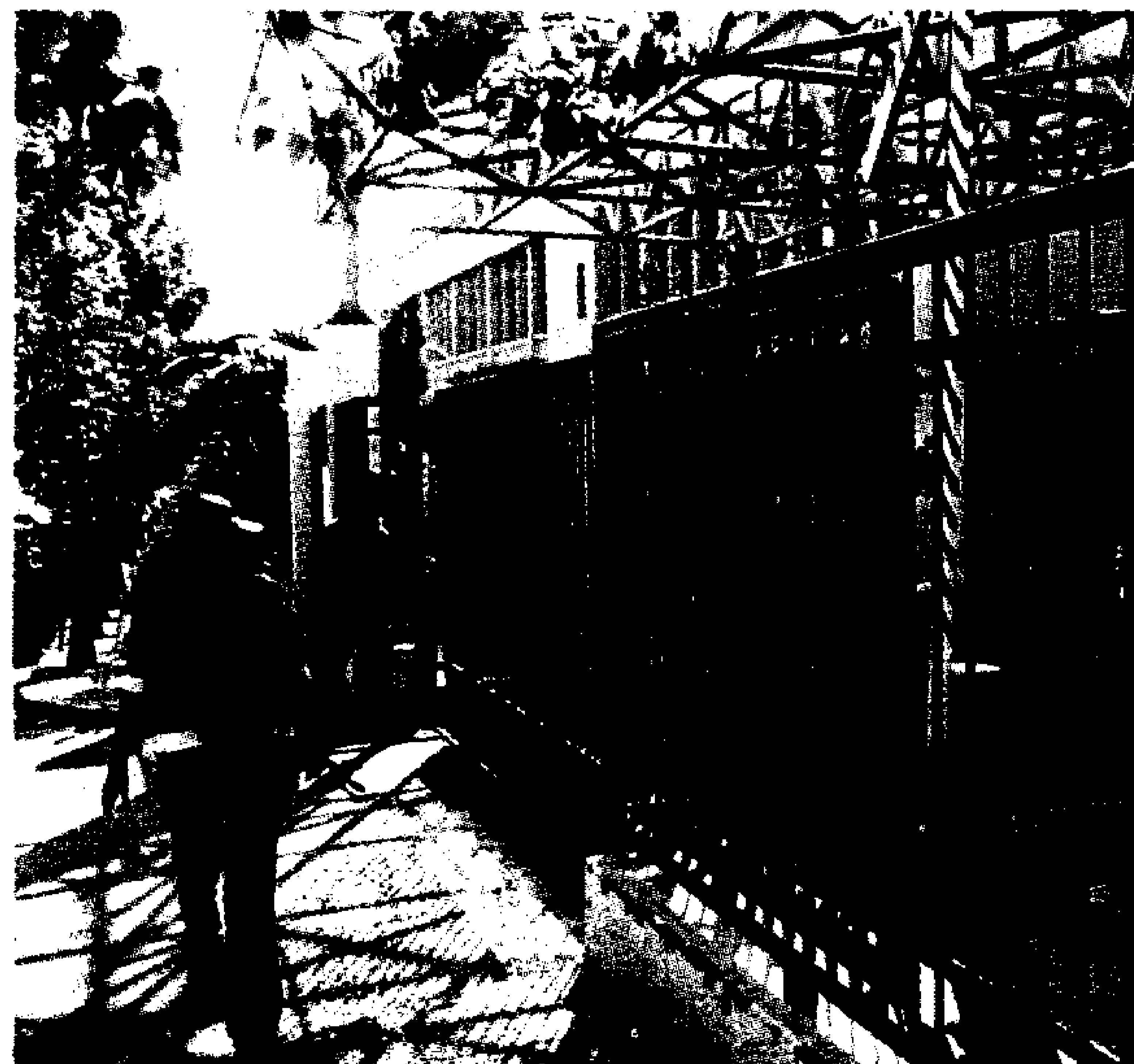
Η απουσία σοβαρού σχεδιασμού στην εκπαίδευση απειλεί με ερήμωση τα ΤΕΙ της περιφέρειας.

Η εξέλιξη αυτή -που αναμενόταν βέβαια- βρίσκει τα τεχνολογικά ιδρύματα σε μια καμπή που έχει δύο όψεις. Από τη μία πλευρά, τα τελευταία δύο χρόνια υπήρξε μια θεσμική αναβάθμιση, με αιχμή τον επίμαχο νόμο-πλαίσιο, ο οποίος προχώρησε ένα βήμα, εντάσσοντας τα ιδρύματα στην ανώτατη εκπαίδευση. Βήμα που θα ενισχυθεί ακόμη περισσότερο, εφόσον τους δοθεί το δικαίωμα χορήγησης μεταπτυχιακών τίτλων. Από την άλλη πλευρά, όμως, η περίφημη καθιέρωση της βάσης του «10» αφυδάτωσε τα ι-