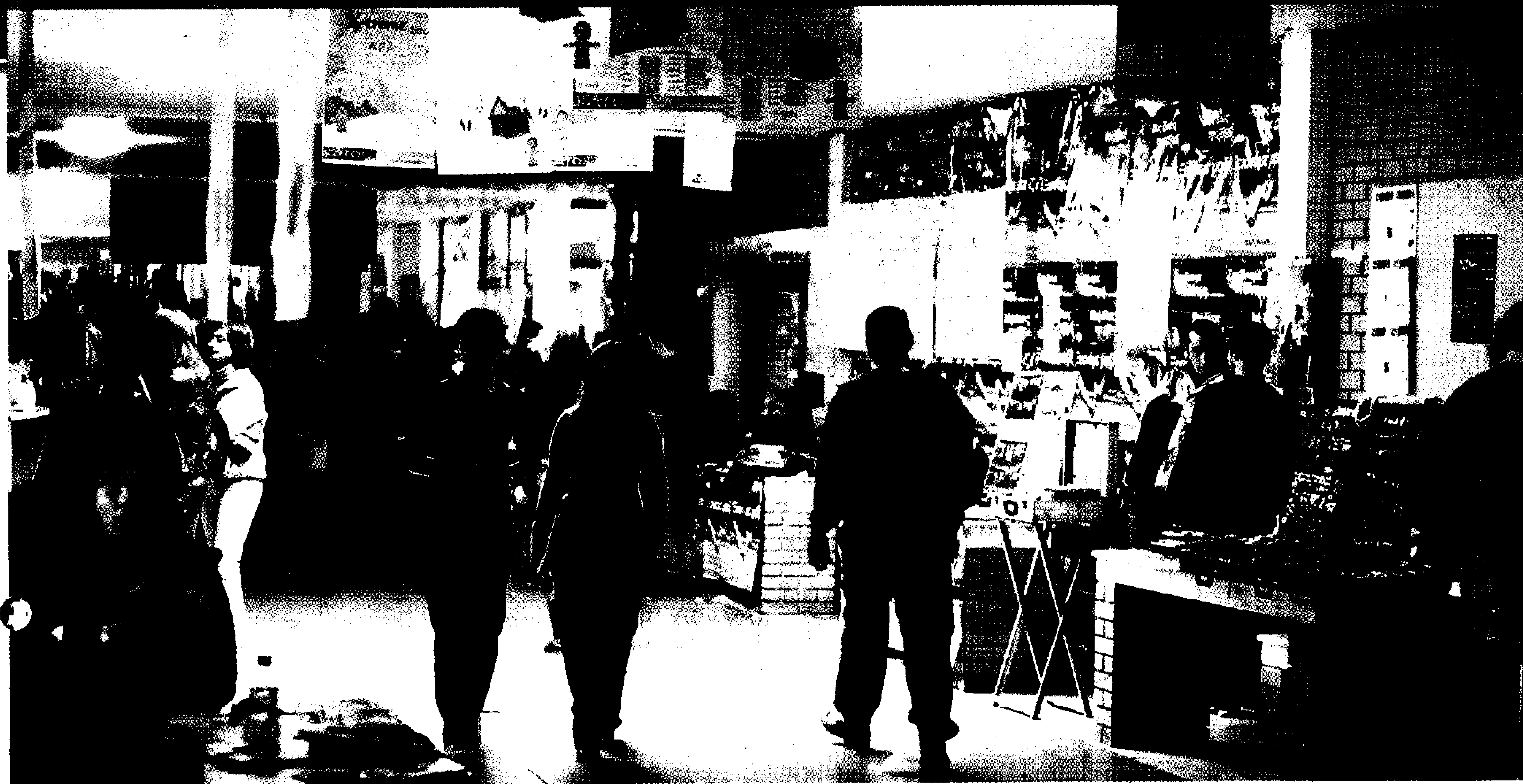
Μια απέραντη ακαδημαϊκή πολιτεία 35.000 σπουδαστών φιλοξενεί στις εγκαταστάσεις του στο Αιγάλεω το 35 ετών ΤΕΙ της Αθήνας.

γαστούν σε βιβλιοθήκες, σε υπηρεσίες τεκμηρίωσης και συστημάτων πληροφόρησης του ιδιωτικού και του δημόσιου τομέα.