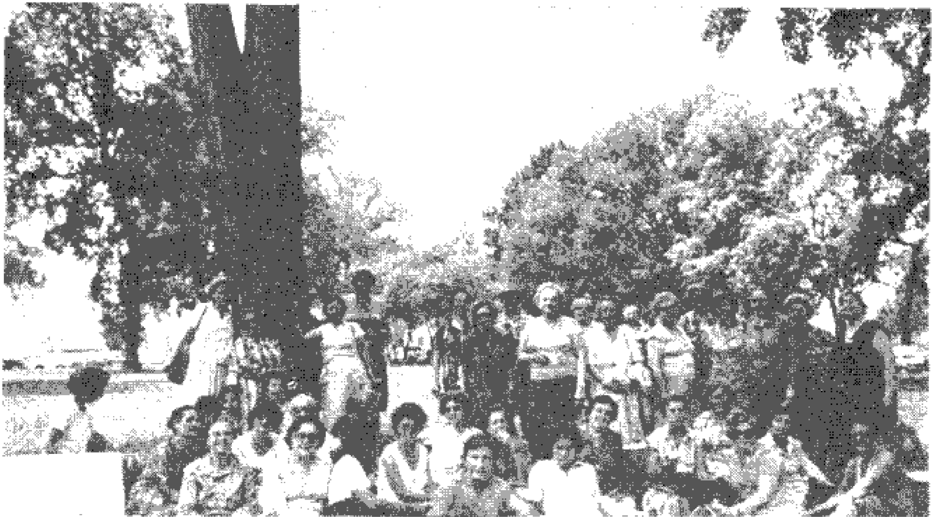
Ἐκδρομὴ εἰς Οὐάσιγκτον.

Τὸ Συνέδριον ἐταλαίωσεν. Αἱ θύραι ἐκλείσαν. Αἱ ὀμιλίας ἐσταμάτησαν. Αἱ Ἀδελφαὶ ἐπέστρεψαν εἰς τὰς γῆρας των. Καὶ ὅλοι αἱ Ἑλληγιῖδες ἐγυρίσαμεν εἰς τὴν γαλανὴν πατρίδα μας ἐνθουσιασμέναι, ἔτοιμαὶ νὰ μοιρασθῶμε μὲ τὰς συναδέλφους μας ὅσα ἐμάθαμε καὶ μὲ τὴν διάθεσιν νὰ νοσηλεύσωμε καλῶτερον τοὺς ἀρρώστους ἀδελφοὺς μας.